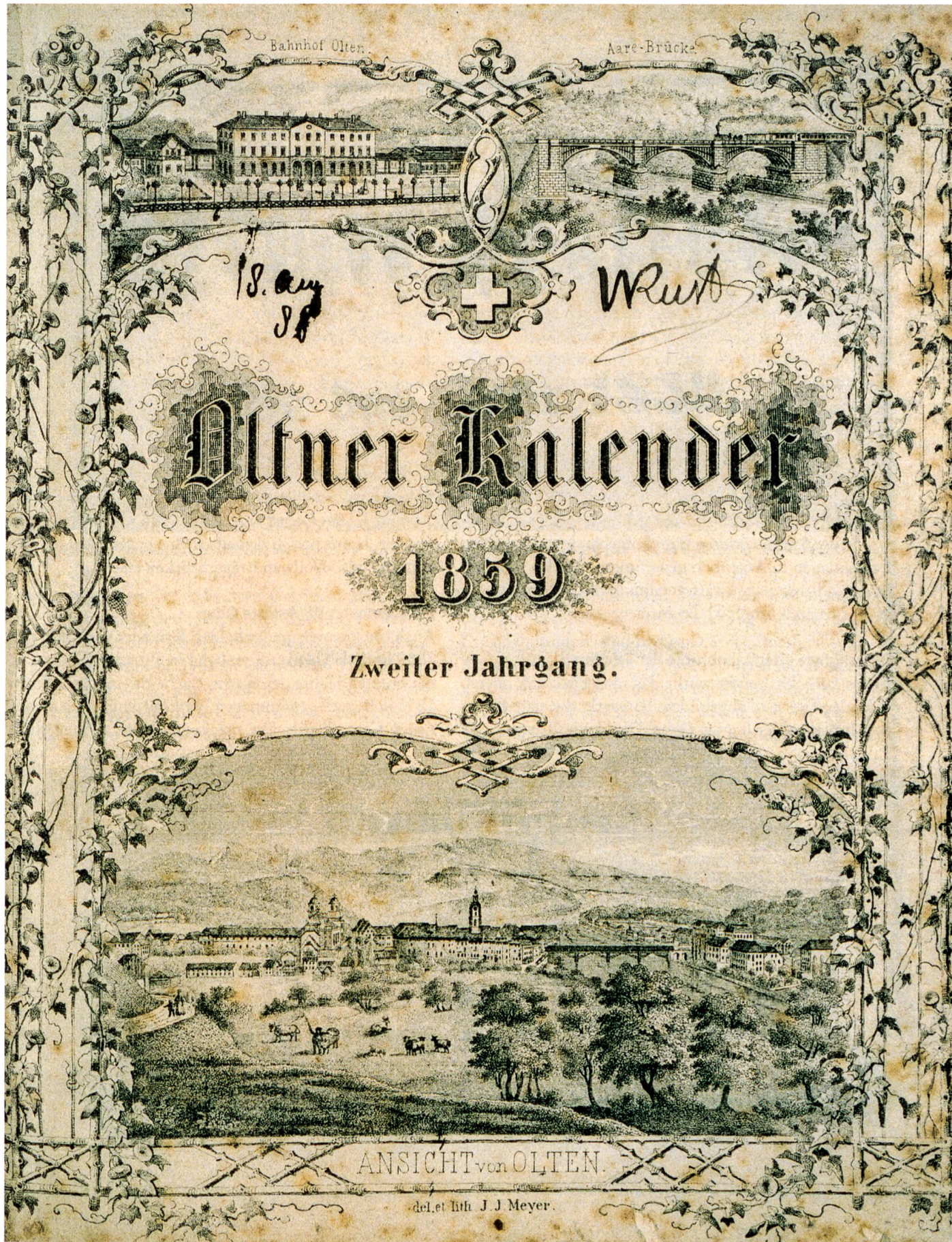
Das Titelblatt des «Altner Kalenders» 1859, gezeichnet und lithografiert von J. J. Meyer