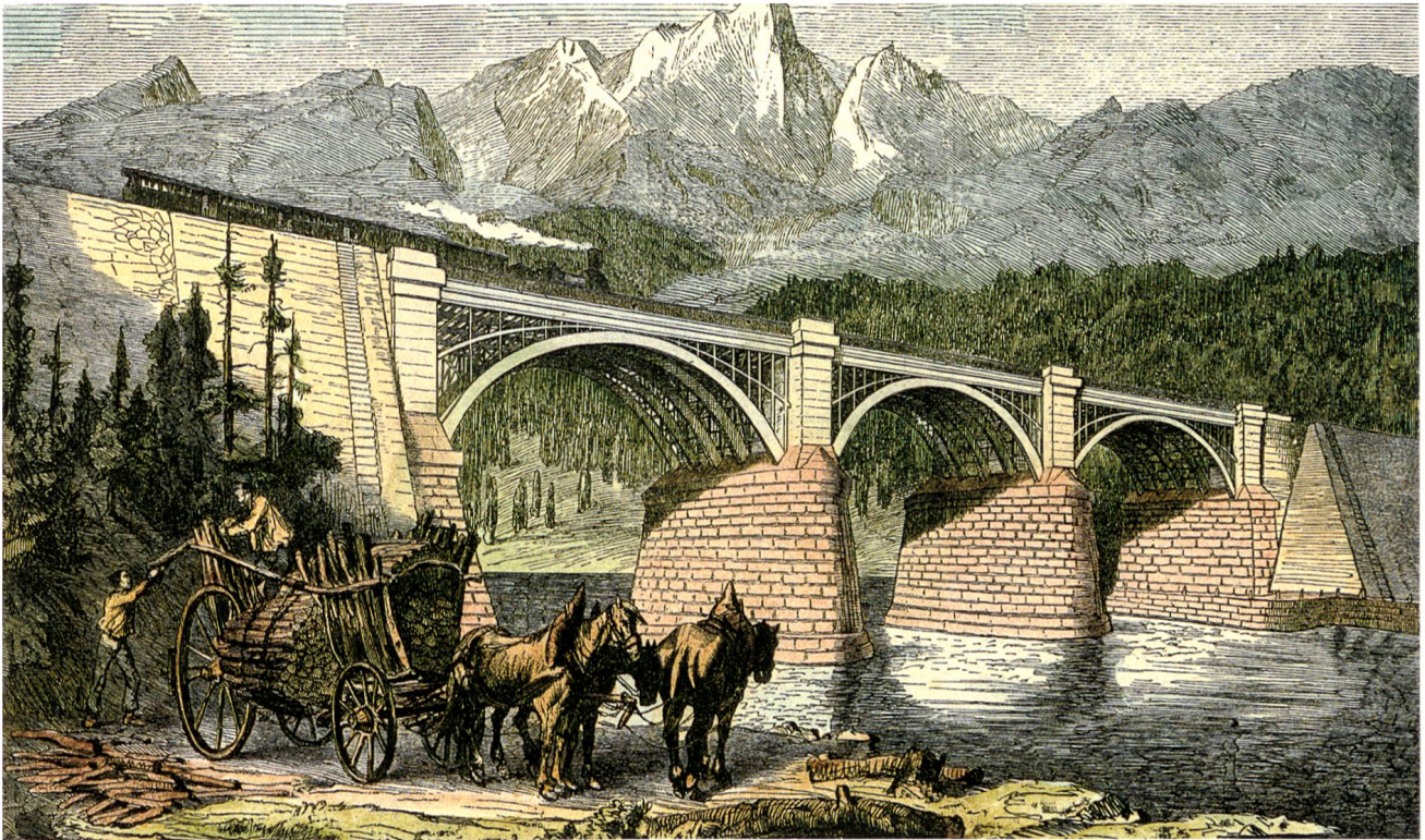
Die «eiserne Blechbogenbrücke bei Olten», Xylografie aus der «Illustrierten Zeitung» 1858 (nach einer Zeichnung von A. Beck)

zeigt den grossen, ausgedehnten Gebäudekomplex vor dem Hintergrund des Hardwaldes mit den Felsen der Hardfluh, offensichtlich vom Westufer der Aare her aufgenommen. Dieses Bild macht gut verständlich, dass die Bahnwerkstätte mit ihren zahlreichen Gebäuden, mit den rauchenden Kaminen und der vorbeiziehenden Eisenbahn der kleinen Aarstadt Olten in kurzer Zeit nicht nur viele willkommene Arbeitsplätze gebracht, sondern ihr auch zu wirtschaftlichem Aufschwung und zu mehr Bedeutung verholfen hat.