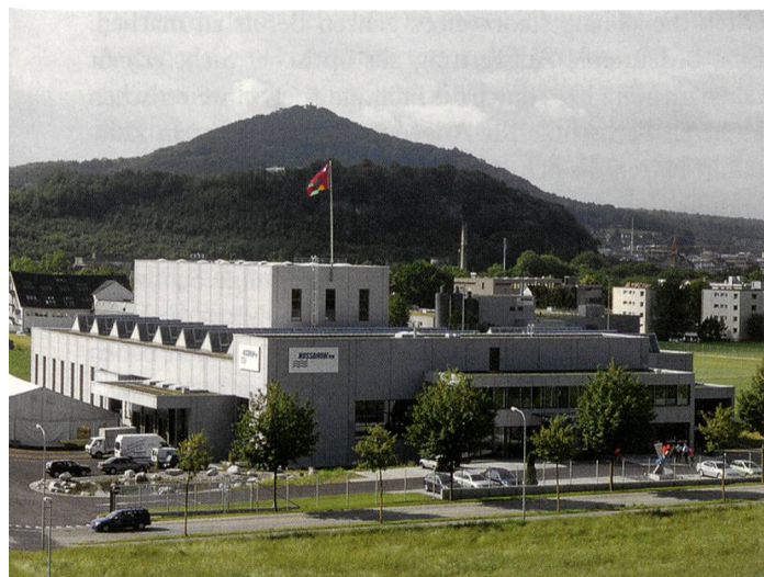
R. Nussbaum AG Zentrallager in Trimbach

Neues Leben in alten Mauern: Kurz vor Jahresende 2003 vermeldete die Tivona AG als Grundeigentümerin, dass sie das im Jahr 1923 erstellte Usego-Gebäude an der Solothurnerstrasse im Westen der Stadt Olten sanieren und einer attraktiven Nutzung mit Verkaufsläden, Büros, Praxen und Schulungsräumen zuführen will. Zu diesem Zweck will sie rund 11 Mio. Franken investieren. Die Oltner Gerolag gab fast gleichzeitig bekannt, dass sie auf ihrem 33 000 Quadratmeter grossen Areal an der Industriestrasse für 40 Mio. Franken einen Businesspark mit bis zu 400 Arbeitsplätzen zu erstellen plant. Dazu sollen unter anderem ein neues Logistikzentrum der Gerolag-Tochter OLG (Oltner Lagerhaus- und Speditionsgesellschaft AG), aber auch ein Hotel und ein Saal für 250 Personen gehören.