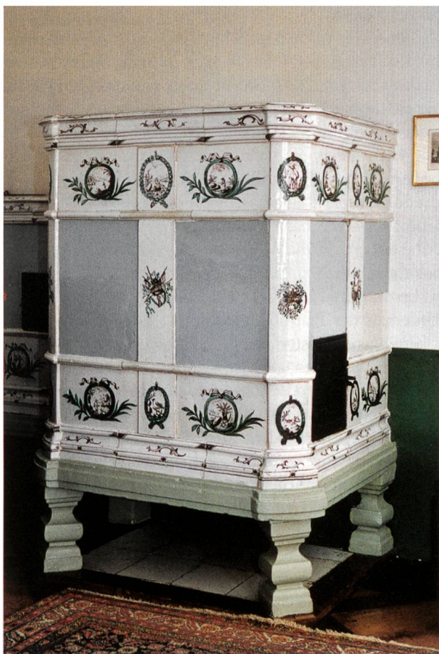
Ofen mit den Jagdsymbolen im Studierzimmer