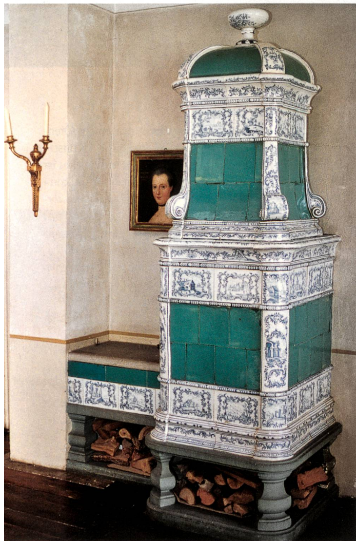
«Zürcher Ofen» im Rittersaal

Im Rittersaal ist an der Nordseite ein Cheminée eingebaut und ein Turmofen aus einer Zürcher Manufaktur aufgesetzt. Die Fries- und Kranzkacheln sowie die Lisenen sind mit Rocaillemalereien, mit Landschaftsdarstellungen, mit Seen-, Fluss- und Ufersiedlungen, mit Burgen, Brücken und Jagdszenen usw. blau bemalt. Sie fassen die meergrünen Füllkacheln ein. Weil auch hier keine Signaturen zu finden und keine schriftlichen Unterlagen der Familie Meidinger vorhanden sind, welche Aufschluss über die Herkunft der Öfen geben könnten, ist man auf Mutmassungen angewiesen. Die Arbeit muss um 1750 bis 1770 entstanden sein und stammt wohl aus der Manufaktur Locher in Zürich. Der Ofen ist nicht ganz originalgetreu aufgebaut; jedenfalls ist die nebenan angebrachte Sitzbank wohl auf Wunsch der Eigentümer in dieser Manier hingesetzt worden.