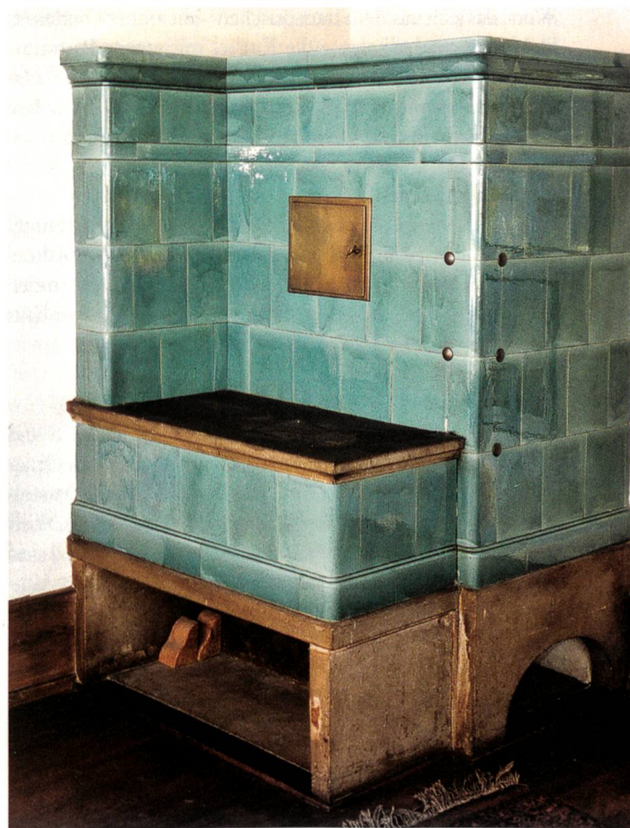
«Kunst» im Rielasingerzimmer