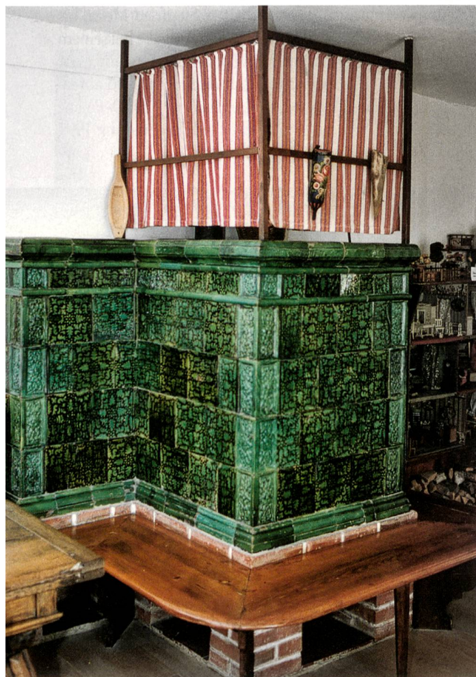
Patronierter Ofen in der Bauernstube

Als Wohnschloss, und als das benutzte Familie Meidinger und auch ihre Nachkommen Wartenfels vom Frühjahr bis zum Herbst, musste nicht nur eine intakte Infrastruktur mit einer funktionierenden Wasserversorgung und elektrischer Kraftzufuhr eingerichtet werden, sondern es brauchte auch eine Heizanlage, damit die Räume wohnlich wurden. Wie und mit welcher Ofenart Räume erwärmt wurden, kann mit Sicherheit nicht mehr eruiert werden. Eines steht aber fest: Die jetzt im Schloss stehenden Öfen wurden alle durch die Familie Meidinger erworben und in den verschiedenen Räumen neu aufgesetzt. Einzig die Küchenfeuerung, welche zum Kochen diente, und der rückwärtige Ofen im Esszimmer mit den weissen Keramikplatten stammen wahrscheinlich aus dem 18./19. Jahrhundert, mussten aber renoviert und teilweise mit neuen Platten verkleidet werden.