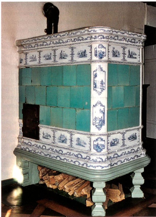
Ofen aus der Manufaktur Fischer, Aarau