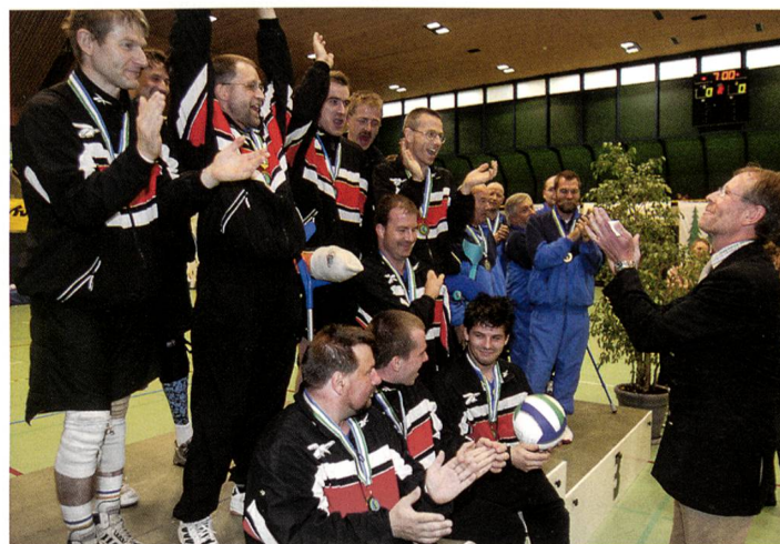
Europa-Pokal im Sitzball der Behinderten