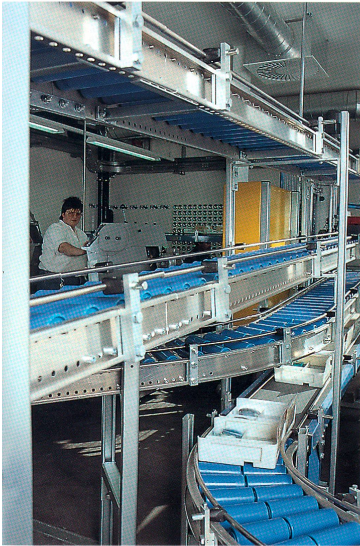
Schnelle, moderne Förderanlagen führen die Aufträge in logisch ausgeklügelter Abfolge von einem Produktionsschritt zum anderen