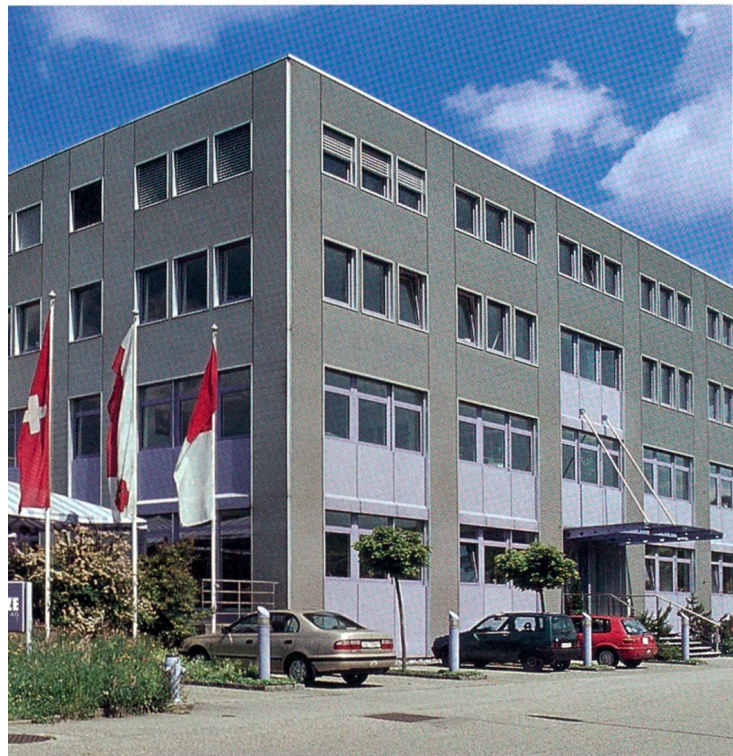
Das hochmoderne Fabrikationsgebäude an der Industriestrasse in Trimbach

Nach Meinung vieler Experten stellen die «KMU», die «Kleinen und mittelgrossen Betriebe», das solide Rückgrat unserer Wirtschaft dar. Tatsächlich gibt es eine grosse Zahl kleinerer und mittlerer Firmen, die sich, oft ausserhalb des Scheinwerferlichts der aktuellen Wirtschaftsberichte, mit sehr viel Einsatz und Erfolg unter schwierigsten Bedingungen am Markt behaupten. Auch in unserer Region könnte man eine ganze Reihe solcher Unternehmen aufzählen. Ein Betrieb, der ohne Zweifel als Musterbeispiel angesehen werden kann, ist die Trimbacher Firma Reize Optik AG , die 2003 ihr 50-Jahr-Jubiläum feiern konnte.