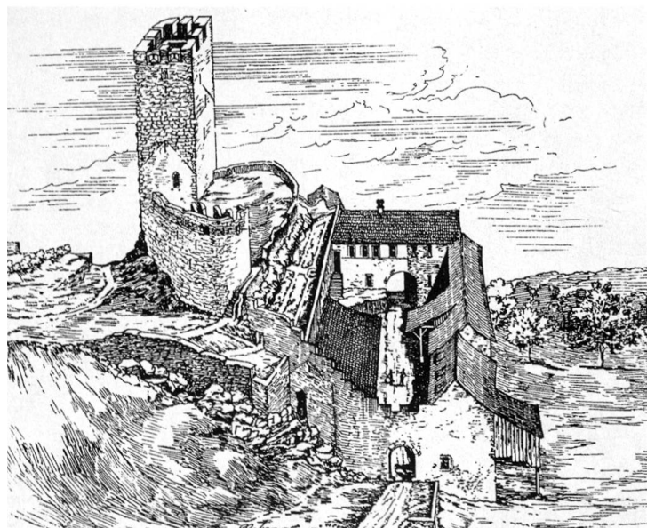
Schloss Gösigen 1892. Zeichnung von J. R. Rahn, dem Begründer der Statistik Schweizerischer Kunstdenkmäler.

Solothurn verwaltete die Herrschaft Gösigen durch einen Landvogt. Da das Schloss nach der Zerstörung von 1444 wieder aufgebaut werden musste, wohnte dieser vorerst auf der Wartenfels bei Lostorf. Im Ganzen residierten hier 12 solothurnische Vögte, unter ihnen von 1485 bis 1489 Benedikt Hugi, der Verteidiger des Schlosses Dorneck während des Schwabenkrieges von 1499. Das inzwischen