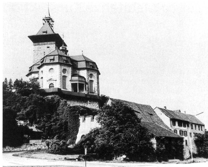
Schlosshof und Ökonomiegebäude vor dem Umbau 1981

Nachdem Olten am 7. März 1798 von den Franzosen besetzt worden war, stiessen französische Bataillone ins Niederamt vor, wobei das Schloss Gösgen zerstört wurde und die Bevölkerung die Demütigungen durch das zuchtlose Kriegsvolk zu spüren bekam. Was nach dem Brand des Schlosses an Brauchbarem noch erhalten blieb, benutzten die Leute von Gösgen und der Umgebung als Baumaterial. Nach einem Beschluss der helvetischen Regierung galten aber die Schlösser und die dazugehörenden Güter als National-eigentum und wurden verkauft. Fünf Aarauer Bürger erwarben das Schloss Gösgen, dessen Ökonomiegebäude beim Brand von 1798 von der Zerstörung verschont geblieben war, mit Scheune, Stallungen, Kornmagazin, Trottbäude und 39,5 Jucharten Land für 13 700 Franken. Die neuen