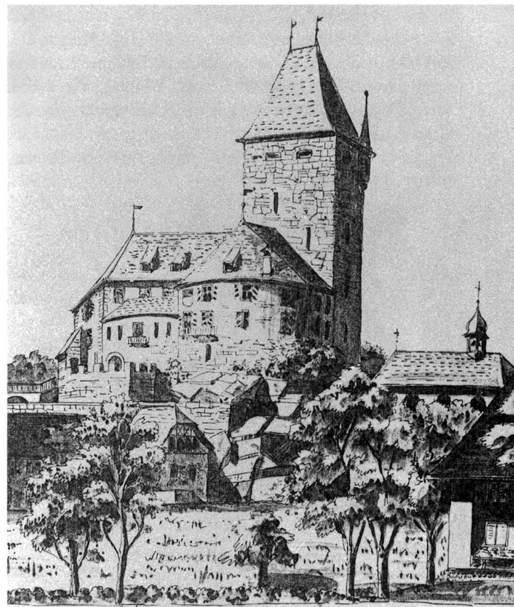
Schloss Göscon zur Zeit der Landvögte (nach einer Zeichnung aus dem Jahre 1734). Ansicht von Osten.