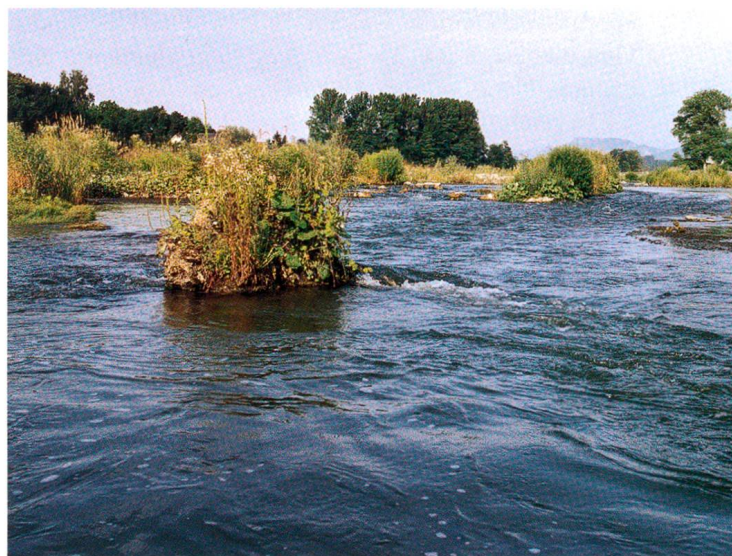
schnell fliessendem Wasser ...