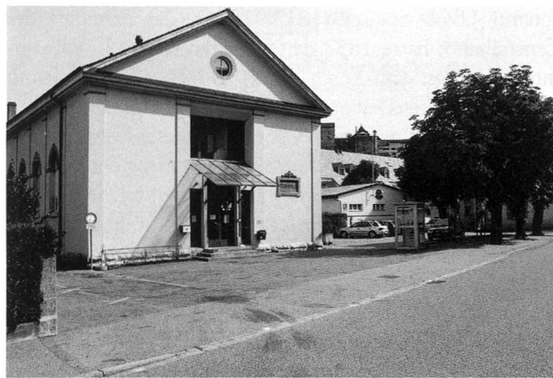
Die Haltestelle in Aarburg war am nördlichen Rand des Städtchens, bei der Turnhalle, geplant.