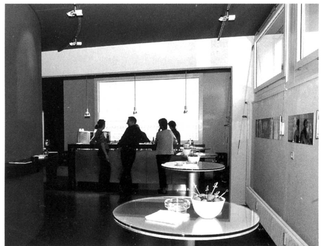
Foyer des theater studio

Früher hatte Olten ein Kleintheater im Herzen der Altstadt. Dem trauerten viele Theaterfreunde lange nach. Zehn Jahre lang hatte Olten dann ein Kleintheater weit draussen im wenig attraktiven Industriequartier. Schön, dass das Stadtzentrum sein Kleintheater jetzt endlich wieder hat.