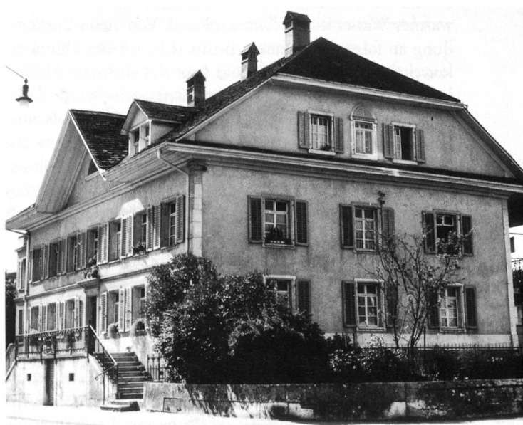
Das einstige «Gerber-Büttiker-Haus» um 1950