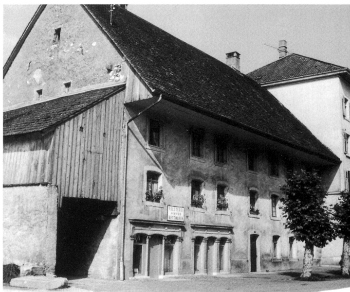
Alte Gerberei Büttiker und Restaurant Pflug um 1974