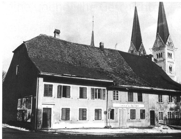
Die Liegenschaft 211, einst Wohnhaus, Scheune und Farb um 1966