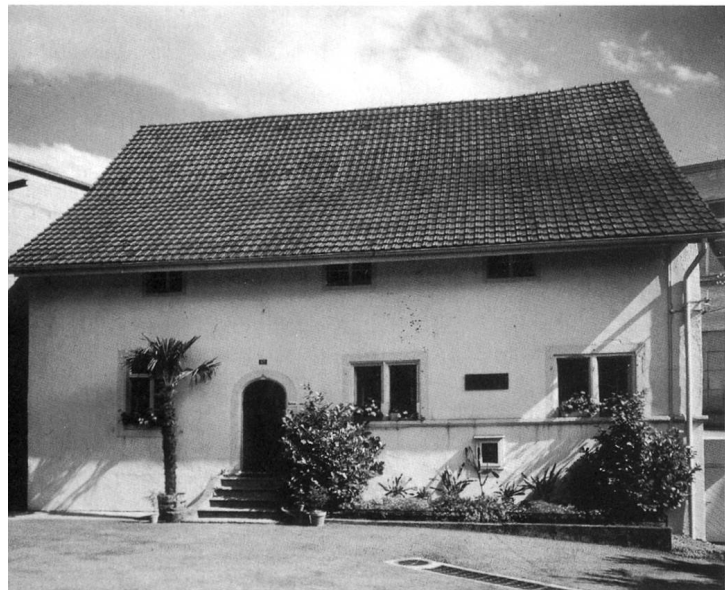
Die ehemalige äusserere Mühle im Hammer um 1950

links der Aare gelegene Gemeindegebiet und die Stadt aus der Vogelschau. Man erkennt auf dem Plan zwar einige wesentliche Details, etwa den Schiessstand in der «Schützenmatt» und einige alte Gewerbebetriebe entlang der Dünnern. Immerhin aber sind auf dem Erb-Plan von 1746 im Hammer die «Öhli», die «Walkhi», die «Ribi», die «Mühli» und die «Trottstreckhi», d.h. Konrad Krugs Ölmühle, die innere Strumpfwalke, die zur äusseren Mühle gehörende Reibmühle, die äussere Mühle und der Drahtzug eingetragen. Im Detail, freilich, kann man sich auf diese doch sehr freizügige Übersicht ebenfalls nicht verlassen.