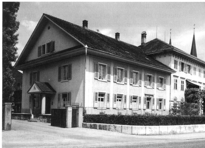
Das ehemalige Verwaltungsgebäude der Baufirma Constantin von Arx, dahinter die Villa der Filztuchfabrikanten Munzinger