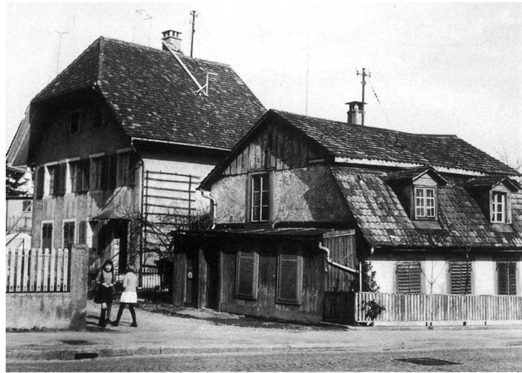
Der untere Feigelhof um 1967

die Schreinerei und das Farbhaus der neu erbauten Wollspinnerei und Weberei der Familie Munzinger. Diese ist auf unserem Brunnenplan eingetragen mit der Nummer 306. Die Wollspinnerei wiederum wurde 1865 in eine Filztuchfabrik umgewandelt und existiert in erweiterter und modernisierter Form noch heute.