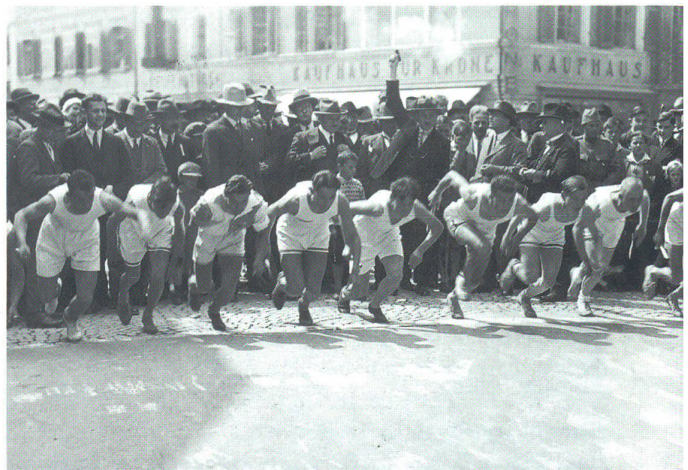
Quer durch Olten 1931

kam anders. Im «Oltner Turner» schrieb der Chronist damals: «Die Organisation des TV Olten lief bereits auf vollen Touren und es klappte alles ausgezeichnet. Leider liess die Zahl der Anmeldungen zu wünschen übrig. Der Schreiber sah diese Entwicklung kommen, denn die goldene Zeit der Strassenstaffelläufe ist endgültig vorbei. Der heutige gute Läufer und Leichtathlet meidet mit Vorteil Wett-