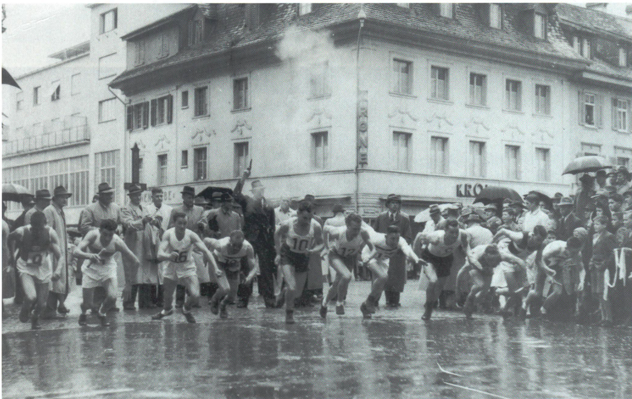
Quer durch Olten 1943: Start bei der Stadtkirche