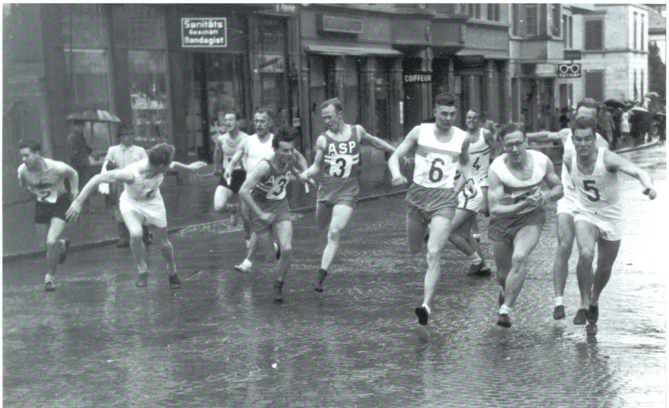
Hart auf hart beim ersten Wechsel

kämpfe auf hartem Asphalt, welche seinen Füßen nicht allzu zuträglich sind...» Allerdings wurde in der Öffentlichkeit die kurz davor aufgestellte Bauwand beim Stadthausneubau als offizieller Grund aufgeführt, welcher zur Absage am Vorabend (!) des Quers führte. Aus Anlass des 125-jährigen Bestehens des TVO wurde 1984 – eigentlich gedacht als Start für eine Wiedereinführung – ein letztes Quer durch Olten durchgeführt. Daran haben mehrheitlich Oltner Sportvereine teilgenommen. Das gezeigte bescheidene Interesse hat die Verantwortlichen des TVO veranlasst, auf den Versuch zur Wiederbelebung des Quers zu verzichten.