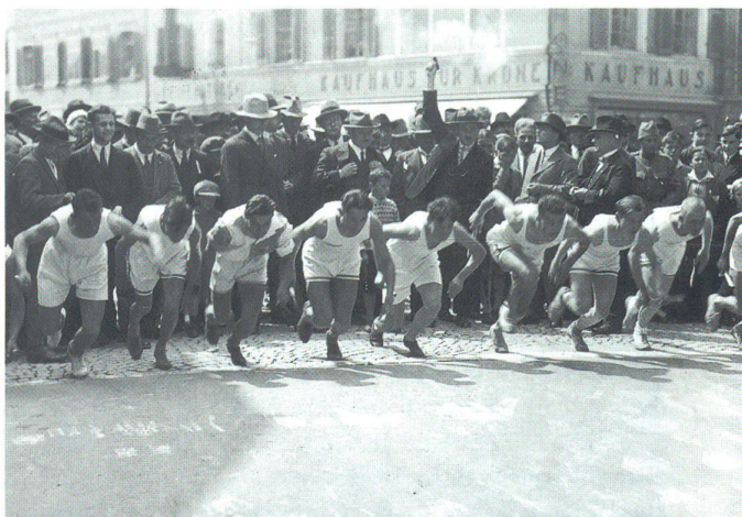
Quer durch Olten 1931

kam anders. Im «Oltner Turner» schrieb der Chronist damals: «Die Organisation des TV Olten lief bereits auf vollen Touren und es klappte alles ausgezeichnet. Leider liess die Zahl der Anmeldungen zu wünschen übrig. Der Schreibende sah diese Entwicklung kommen, denn die goldene Zeit der Strassenstaffelläufe ist endgültig vorbei. Der heutige gute Läufer und Leichtathlet meidet mit Vorteil Wett-