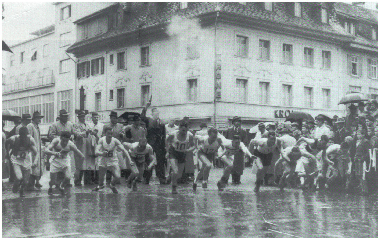
Quer durch Olten 1943: Start bei der Stadtkirche