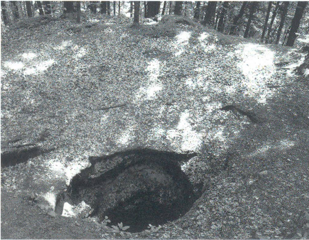
Burghügel mit einem der beiden in den Molassefels getriebenen tiefen Sodbrunnen

ziehen, floh er in den Unteraargau, erhielt Safenwil als Lehen und blieb auf der Burg Scherenberg bis zum Aussterben der Zähringer im Jahre 1218. Dann kehrte er in seine Heimat zurück.