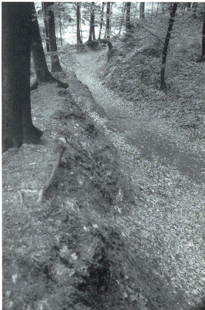
Die Lage der Burg Scherenberg war geschickt gewählt: Sie beherrschte eine einst wichtige Verkehrsrouten, die «Alte Zofingerstrasse», die von Aarau über Kölliken-Safenwil direkt nach Zofingen führte.

Einer der führenden Gegner des Zähringers war der Freiherr von Belp. Um sich der Bestrafung durch den Herzog zu ent-