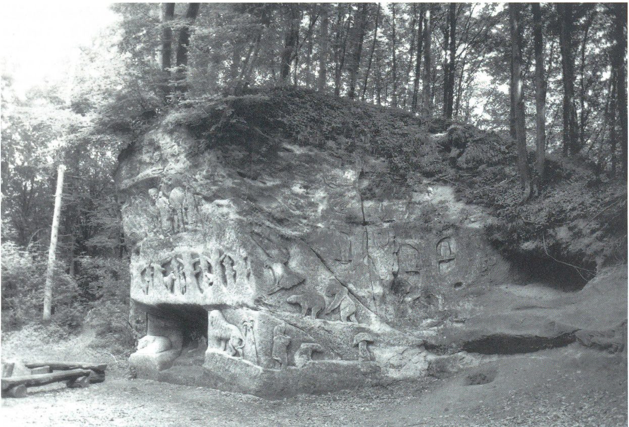
Ruine Scherenberg: Teil des Innenhofes mit den verzierten Sandsteinfelsen

Von der Ruine Scherenberg aus erreicht man in wenigen Minuten einen anderen Punkt von historischer Bedeutung: die 60 Meter höher gelegene ehemalige Hochwacht Brännlis-