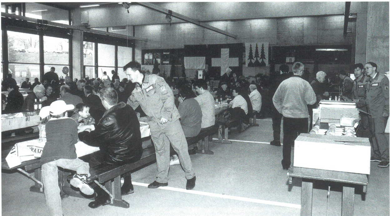
Einweihung des neuen Feuerwehrlokals in Olten