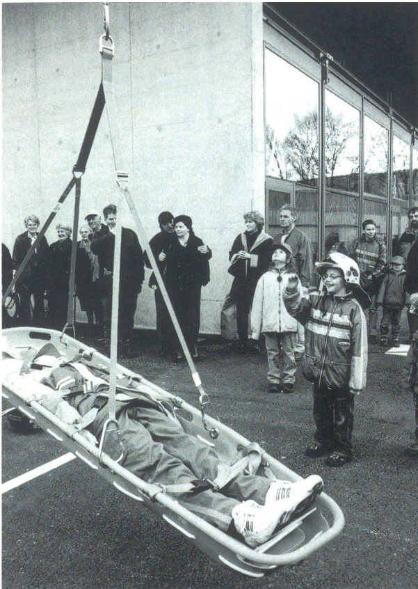
Der «jüngste Feuerwehrmann» der Stadt Olten