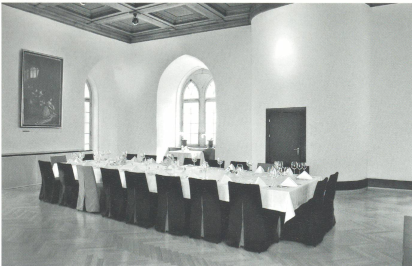
Das Sälischlössli von Süden her gesehen und der Ritteraal, wie er sich heute präsentiert.

chen Schlosscafé, dem Eingang und dem Empfang für die Gäste des Clubs im Erdgeschoss und den Privaträumen für besondere Anlässe im Obergeschoss. Im Untergeschoss sind die Zentren der komplett erneuerten Haustechnik-Installationen untergebracht. Den oberen Abschluss des Neubaus bildet die vom Ritteraal zugängliche Dachterrasse. Ein Lift verbindet die Geschosse und führt über den Anbau hinaus bis auf die Höhe der Zinnen des Schlosses. Über einen luftigen Steg erreicht man bequem dessen Dachterrasse und geniesst, bei entsprechendem Wet-