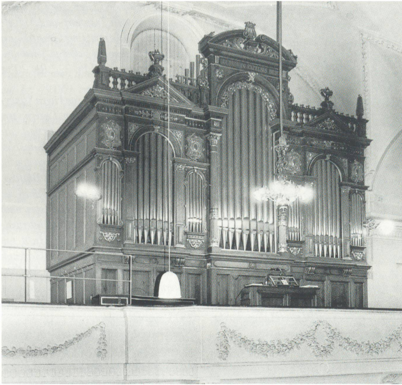
Auch die heutige Orgel von 1879/80 in der Stadtkirche, sie stammt aus der Werkstatt der Firma Kubn, Männedorf, ist ein ganz hervorragendes Werk.

Laut dem folgenden Verzeichniß beliefen sich die Ausgaben auf Fr. 102'0587. 83½ Rp., hierzu wären aber noch mehrere Pösten für Landabtretungen und Fuhrlöhne zu rechnen, welche durch Abrechnung der zwey bezogenen Steuern bezahlt worden, und nicht in den Ausgaben begriffen sind. Nebst dem ist für die geleisteten Frohnungen ebenfalls nichts in Rechnung gebracht worden, als der Betrag der zu diesem Zweck angekauften und verwendeten 783 Maas Wein, 330½ lb. Käs und 7 Klafter Heu, und einigen Trinkgeldern an die Fuhrknechte. Auch die Summe, welche der Staat für den Choraltar verwendet, ist in dem Verzeichnis nicht enthalten