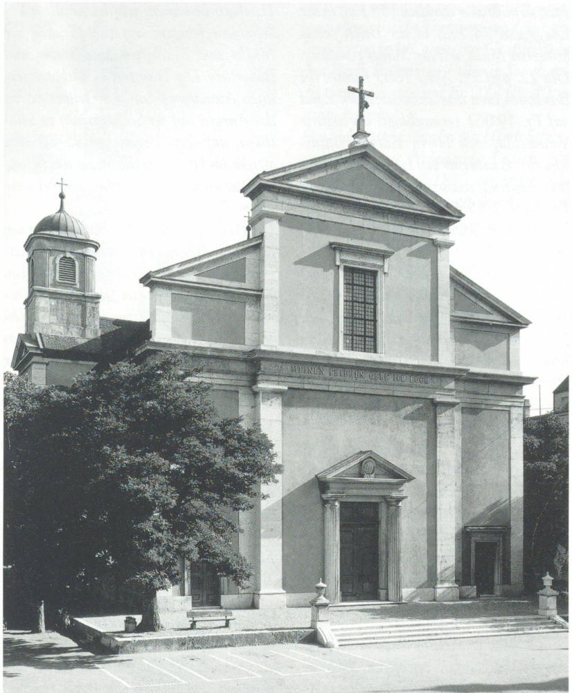
Oben: Unsere Stadtkirche von der Kirchgasse her

Gleichen Tags wurde von ihm beschloßen, daß das Gebäude eine Länge von 172, und eine Breite von 70 Schublen haben soll; später wurde die Länge auf 154 Fuss festge-