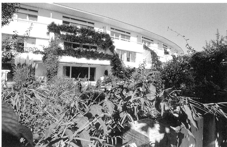
Oben: Die Platanen-Siedlung: Wo sich in den Gartenanlagen behaglich wohnen lässt! Unten: Eine der letzten Überbaumungsmöglichkeiten in Olten: wer wird die Chance nützen?