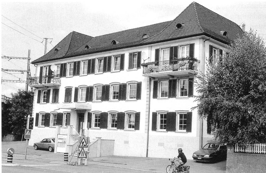
Oben: Harmonische Grosszügigkeit mit modernem Komfort verbindend: das «Sprungbrett» an der Aarburgerstrasse

Nach dem Abschluss des im Nu bis auf die letzte Wohnung besetzten Feigelhofs konnte letztes Jahr vermeldet werden, dass auf dem Gelände des ehemaligen Manor-Areals sowie dem weiten Gebiet der Portland-Cementwerk AG und der Hunziker Baustoffe AG neue Wohn- und Gewerbezentren geplant sind. Eine weitere Wohnsiedlung ist auf dem Gebiet der ehemaligen Stadtomnibus-Garagen zwischen der Solothurner- und der Gallusstrasse in Planung. In der Tat: es tut sich was! An der Aarburgerstrasse 63 wurde in Stadtnähe, zwischen dem Bahngleise und der Landstrasse, mit Blick auf die Aare, die umfassend-grosszügige Renovation des sogenannten «Sprung-