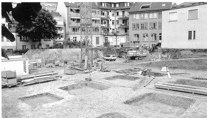
Unten: Die Wohnüberbauung Schürmatt mit hohem Einrichtungsstandard