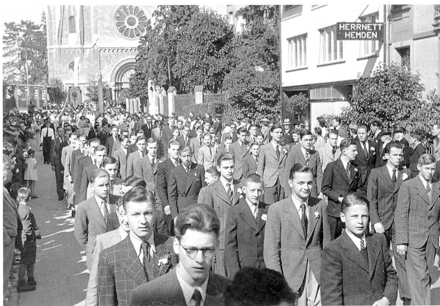
Dokumentation über die grosse Bedeutung, welche zu damaliger Zeit der Oltner Fronleichnamsprozession beigemessen wurde

Es gäbe an und für sich noch viele Müsterchen zu erzählen, so etwa die tägliche