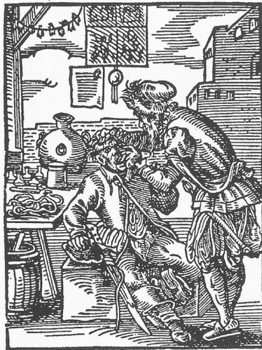
Der Zahnbrecher aus: Jost Amman, Das Ständebuch