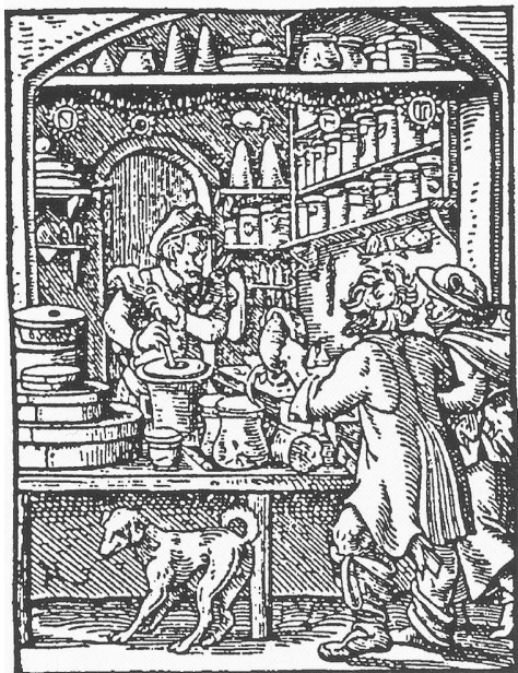
Der Apoteker aus: Jost Amman, Das Ständebuch

Bruchschneidern, Schären, Wundärzten, Badern und Balbierern eindeutig klassifizierende Unterschiede auszumachen. Wahrscheinlich nämlich waren auch hier die Übergänge zwischen den einzelnen «Kategorien von Medizinalpersonen» eher fließend.