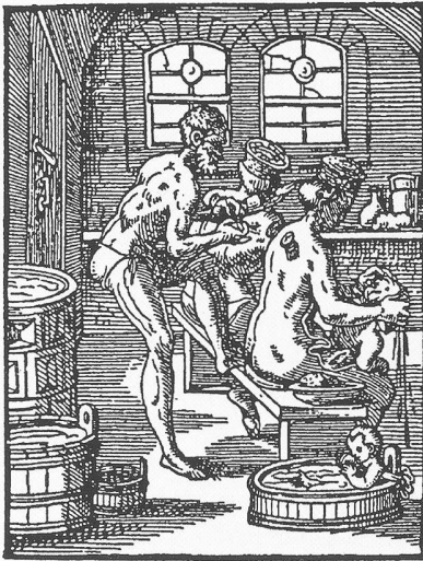
Der Bader aus: Jost Amman, Das Ständebuch

ist». In diesem Falle solle man nämlich, heisst es, einem Esel hinter dem Ohr Blut entnehmen, ein leinenes Tüchlein darein legen und das Blut daran trocknen lassen. Bei Bedarf könne man dann ein etwa zwei Finger breites und daumenlanges Stück davon abschneiden, es in Brunnenwasser legen und dem Kranken das Wasser, wenn es sich gefärbt habe, zu trinken geben, ihn selber aber auf den Stoffstreifen legen und schwitzen lassen. Der Kommentar dazu: «Derjenige ist selber esels genoug, der solche närische mittel braucht; gebrauch dafür geistliche mittel und verhalte dich, daß dir weder teuffel noch gespänst kan schaden.» 42