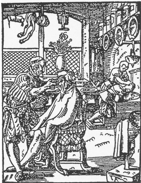
Der Barbierer (Scherer) aus: Jost Amman, Das Ständebuch

Die Fragen 127 bis 130 regeln das Vorgehen gegen den «kalten und den warmen Brand», die Fragen 131 bis 142 dasjenige gegen Geschwüre, Ausschläge, Furunkeln, Fisteln usw. Die Fragen 143 bis 170 schliesslich geben Auskunft über die Anwendung von Pulvern, Pflastern, Salben und Ölen und über deren Herstellung.