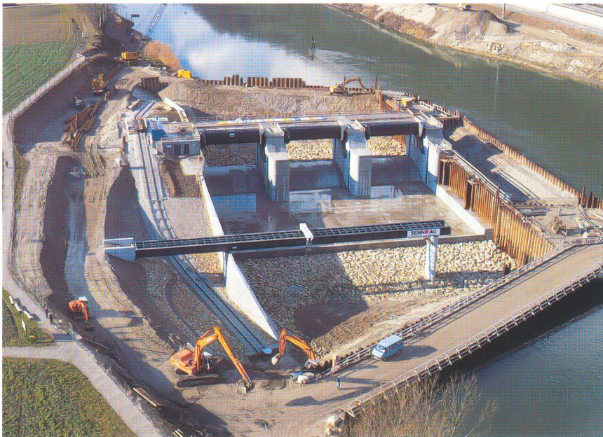
Noch im Trockenen: Das fertig erstellte Stauwehr im Januar 1998

13 Meter. Sie sind mit Beton ausgegossen, und jeder zweite ist dazu noch armiert.