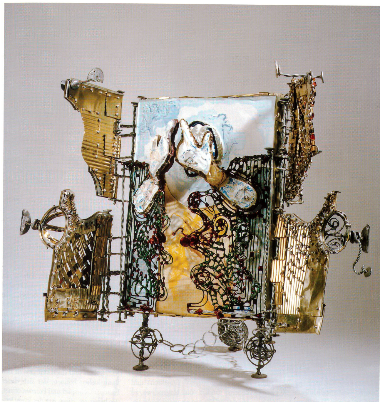
Fundstücke 2, Blech, Draht, Hartgips, bemalt 50 x 40, 1994

Malen und das Werken weiterzugeben, fand er in diesem Beruf. Der Lehrerberuf ist für ihn ein wichtiger Beruf, wesentlich für unsere Gesellschaft. Während dieser Phasen entstehen immer wieder Arbeiten, Zeichnungen, gemalte Bilder, kleine Objekte, oder dann verfällt er einer Sammelwut, sucht Weggeworfenes, weil er instinktiv weiss, dass es einem irgendeinmal wichtig werden könnte.