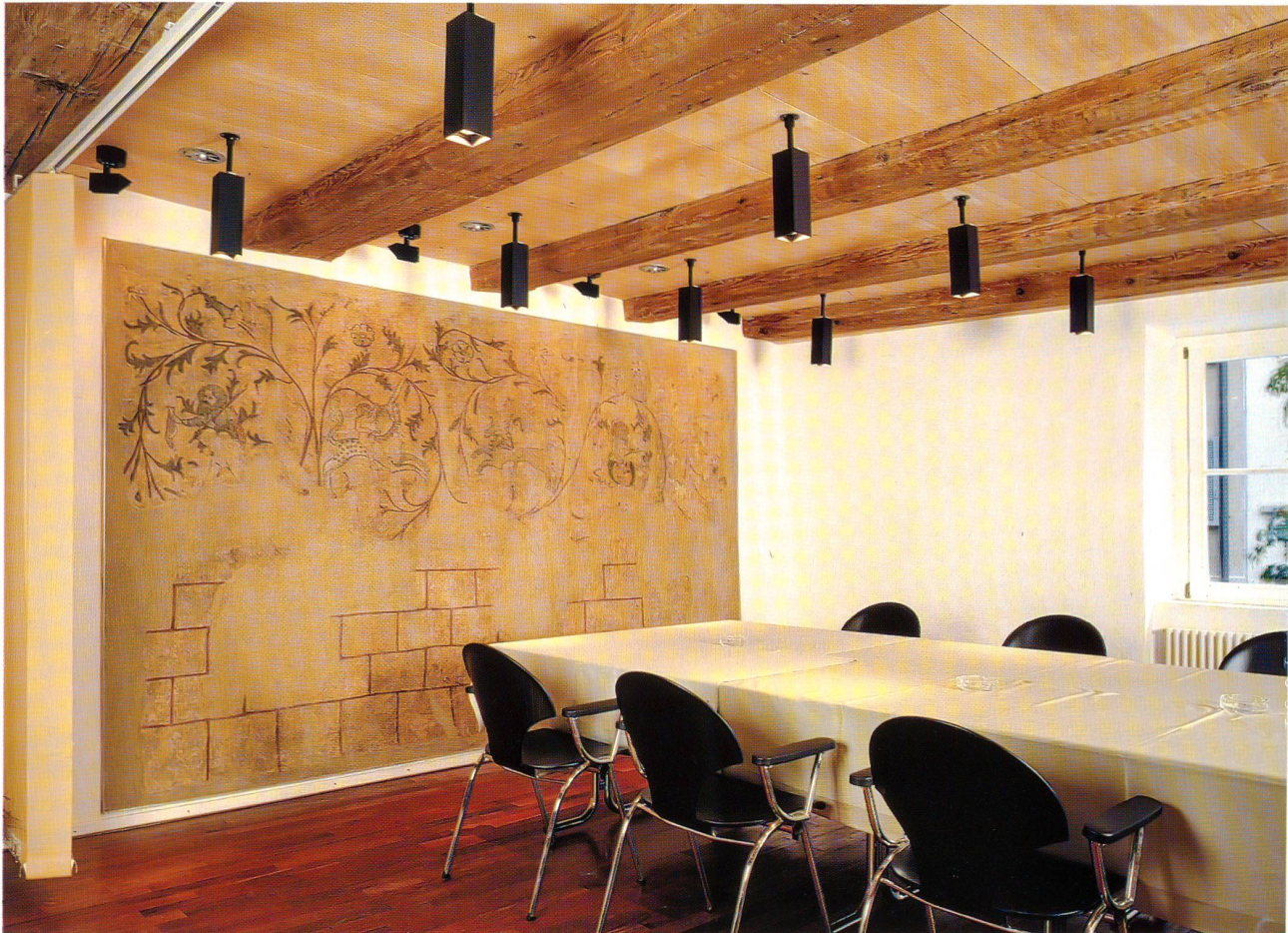
Die Wanddekoration des Hauses Hauptgasse 14 in ihrer neuen Umgebung

Die «Kreuz»-Häuser an der Oltner Hauptgasse sind seit langer Zeit als geschichtsträchtige Gebäude bekannt. Ihre Vergangenheit wurde in den «Oltner Neujaarsblättern» schon mehrmals beleuchtet und beschrieben. Heute kann den bisherigen Berichten ein neues Kapitel beigefügt werden. Wer den grossen Saal im ersten Stock der «Kreuz-Taverne» (über der neuen «Kreuz-Bar») besucht, kann am nördlichen Teil der Westseite ein grosses Wandbild bewundern, das erst vor wenigen Jahren, anlässlich eines umfassenden Umbaus des Hauses Haupt-