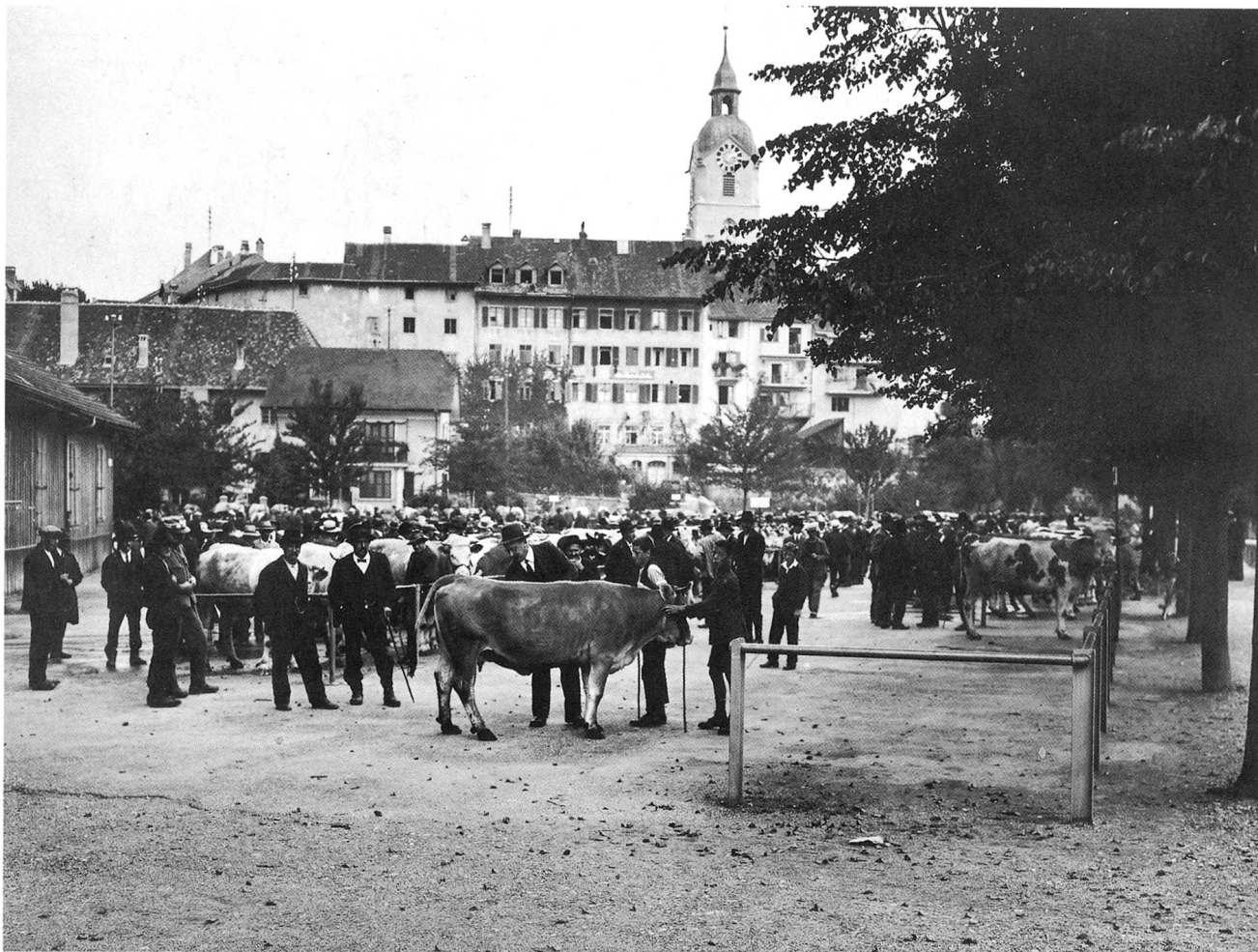
Viehmarkt auf der Schützenmatte zirka 1920 (27/49 StA Olten)

Sportanlagen sich ausbreiten konnten, wo heute auf dem grössten innerstädtischen Platz der Schausteller, der Zirkus und das Riesenrad für kurze Tage die Stadt versammeln. Wo einst auf dem abseitigen Platz Drahtzieher und Walker, Müller und der Ribibetreiber ihrem Gewerbe nachgingen oder wo sich die Schützen und später die Turner, gelegentlich bedroht durch die hochgehende Dünner, im Wettstreit massen, wird heute ein nicht unwesentlicher Teil der Oltner Dienstleistungen angeboten. 5