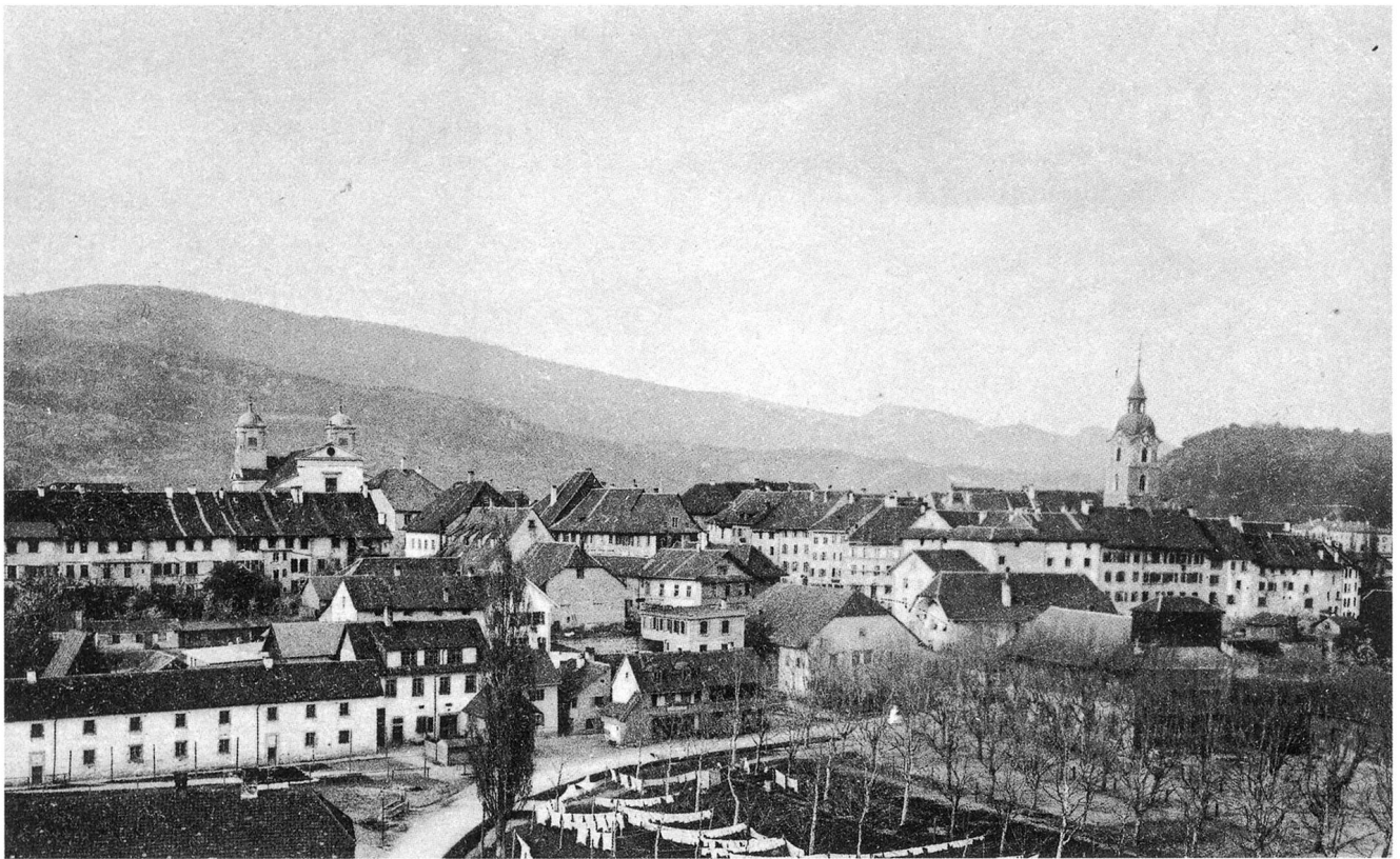
Olten von Südwesten (vor 1895). Die von den Schützen 1876 gepflanzten «Zierbäume» sind bereits zum markanten Element der Allmend geworden (StA Olten 27/1).

neuen Martinskirche die Altstadt als Zentrum ablöste und diese dazu verurteilte, Schauplatz der Fasnacht und des täglichen «Kramens» zu sein. Auch hatte der Bau der Bahnhofbrücke die Durchgangssachse von Holzbrücke und Altstadt nach Norden weggerückt und «die kaufmännische Mitte» zwischen die Handelhofkreuzung und den Hauptbahnhof verschoben, während die Anlage neuer Quartiere, Kirchen und Schulhäuser auf der rechten Aareseite eine eigentliche soziale Mitte der Stadtgemeinde mehr und mehr auflösten. Was nützte da nach der Mitte des 20. Jahrhunderts aller gute Wille, durch einen neuen Bau die Mitte zu markieren; für mehr als für ein in Beton geronnenes Symbol subzentralen Übereifers und kleinstädtischen Ehrgeizes reichte es nicht. Zu einseitig gerieten die Versuche, städtische Mitte zurückzugewinnen, aus jüngerer Zeit. Ein «Platz der Begegnung», eilig am Rand der «Wagner Vorstadt» in den eiszeitlichen Schotterkern des