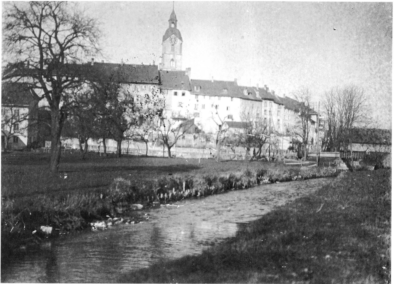
Blick dem Mühlbach entlang, wie er noch 1918 quer durch die Allmend der heutigen Mündung zustrebte

verlegen, initiierten sie eine gestalterische Massnahme, welche für die Weiterentwicklung der Schützenmatte bis auf den heutigen Tag nicht unwichtig werden sollte. Am 24. März 1876 richtete die Schützengesellschaft an den Gemeinderat das Ersuchen, «es möchte ihr gestattet werden, auf der Südseite des Schützenhauses auf Gemeindeland zu etwelchem Schutze vor Wind und Wetter etwa 8–10' von dem Gebäude entfernt auf die Länge der Front desselben eine Anzahl Zierbäume zu pflanzen.» 4 Der Gemeinderat entsprach dem Gesuch der Schützen und leitete damit eine Nutzung ein, welche der Schützenmatt die Aufgabe als Freizone erhalten half. Seit der Dünnerkorrektur und definitiv seit dem Rückstau der Aare kurz nach der Jahrhundertwende konnten die «Wassergrössen» weitgehend gebändigt werden. Jetzt verschwanden die Reste landwirtschaft-