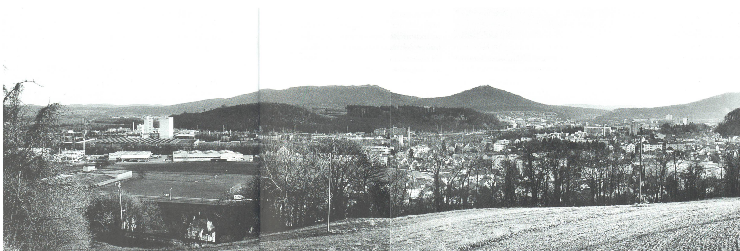
unten: das heutige Panorama