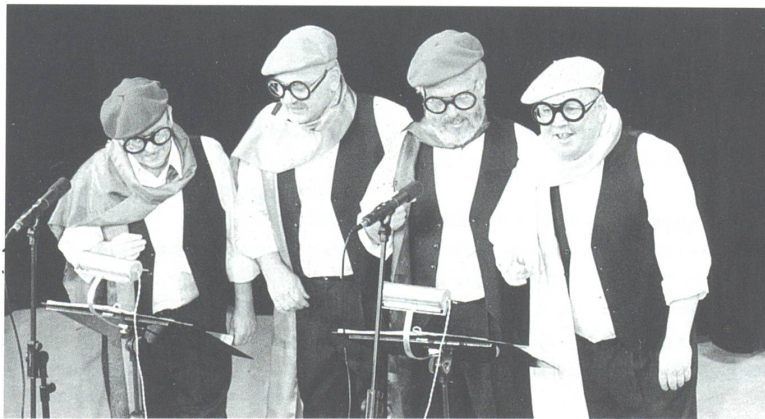
... als Vernissagebesucher an den Oltner Cabaretttagen... ... oder als Fan-Club prominenter Anwesender an den Cabaretttagen