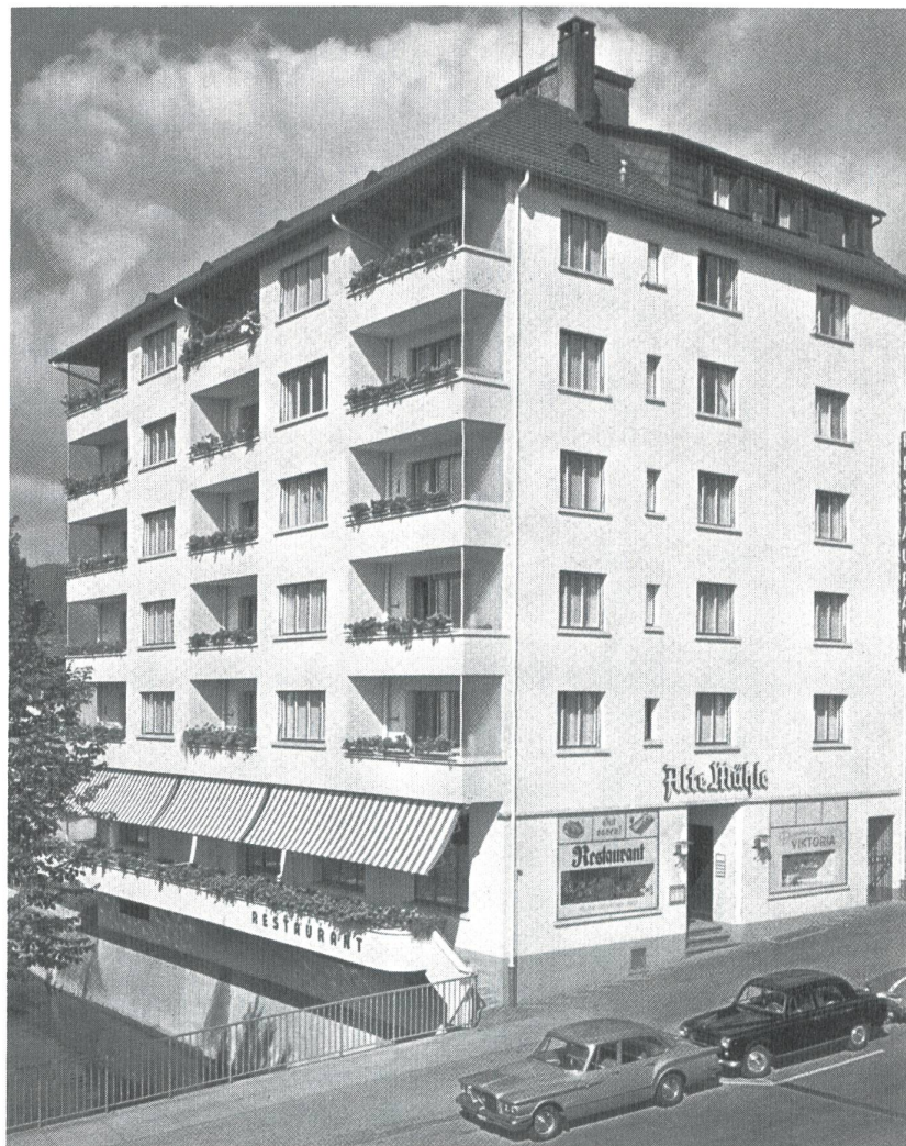
Das Restaurant «Zur Alten Mühle» nach der Renovation von 1962/63.