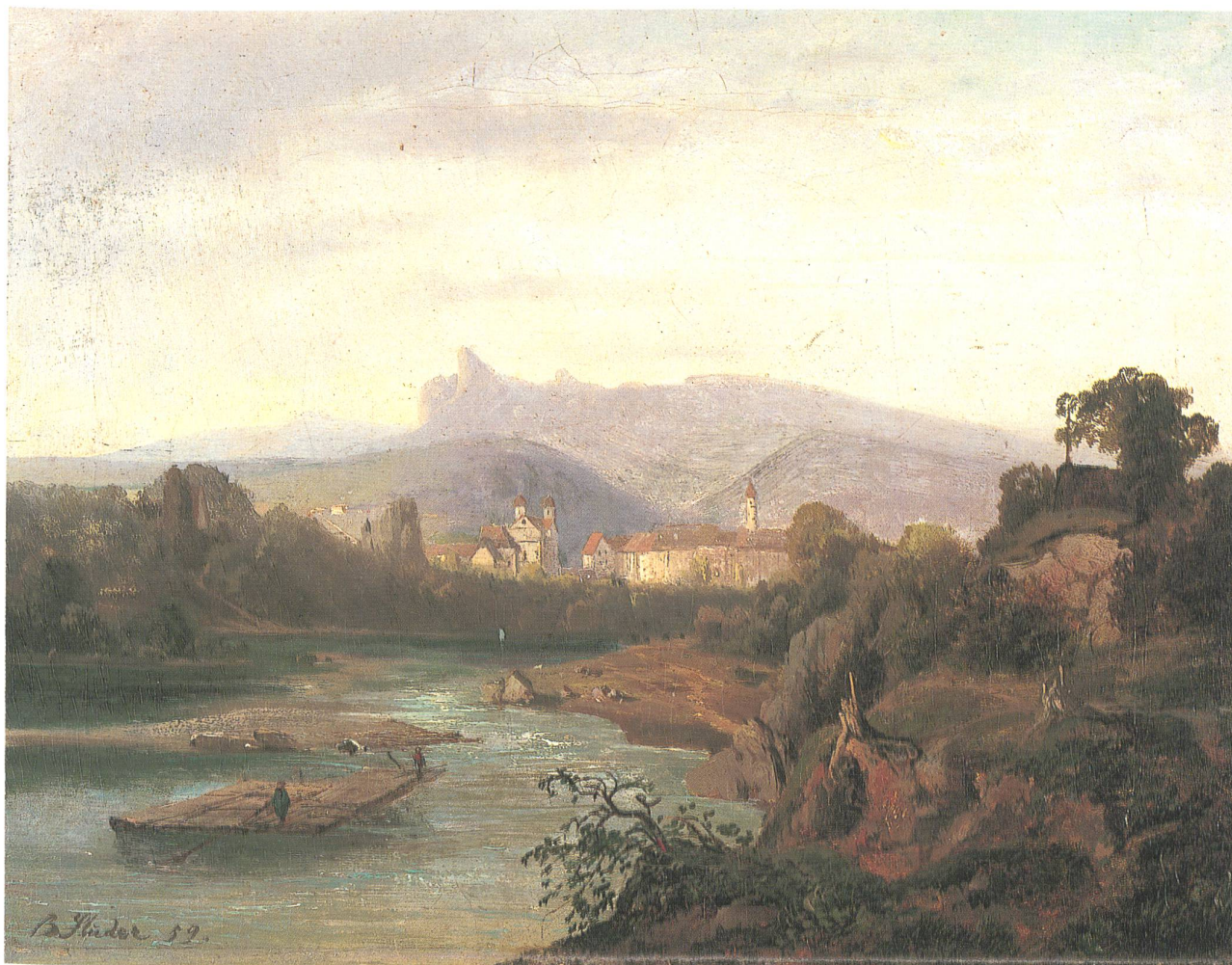
Olten von der Klos her, Ölbild von Bernhard Studer, 1859.

routinierten Zeichner schliessen lässt, wird James Cockburn zugeschrieben, einem englischen Offizier, welcher 1859 die Schweiz bereist haben soll. Schon 1981 erschien in den «Neujahrsblättern» eine alte Oltner Vedute, welche Cockburn zugeschrieben wurde. Allerdings ist dieses Aquarell mit einer interessanten Ansicht einiger Häuser «ennet der Aare» (Cen-