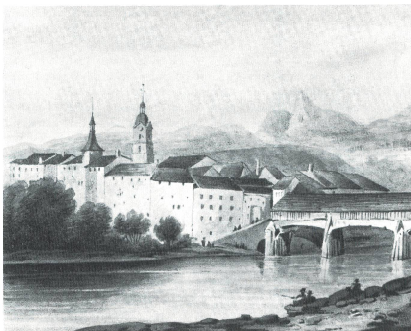
Olten, farbige Lithographie, gezeichnet von Pierre-Luc Ciceri, lithographiert von G. Engelmann, 1828.

routinierten Zeichner schliessen lässt, wird James Cockburn zugeschrieben, einem englischen Offizier, welcher 1859 die Schweiz bereist haben soll. Schon 1981 erschien in den «Neujahrsblättern» eine alte Oltner Vedute, welche Cockburn zugeschrieben wurde. Allerdings ist dieses Aquarell mit einer interessanten Ansicht einiger Häuser «ennet der Aare» (Cen-