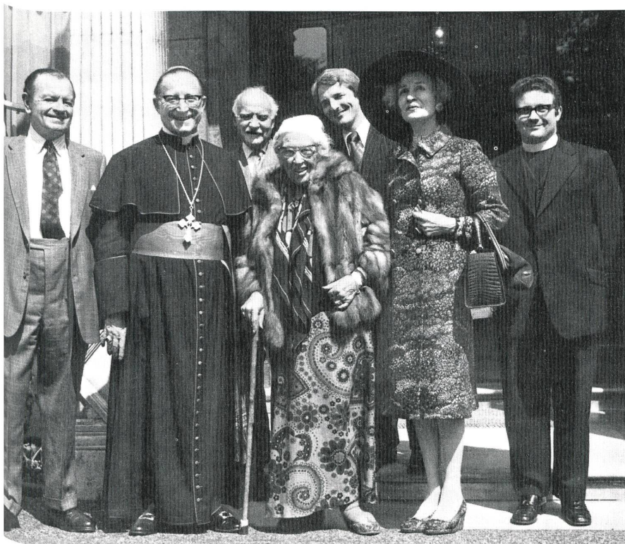
Besuch von Agatha Christie

Heute kann man diesen hohen kirchlichen Diplomaten in seinem Garten am Zehnderweg arbeiten sehen; denn er erholt sich gerne beim Pflanzen und Pflegen von Blumen, aus denen er auch gerne Tischdekorationen zusammenstellt, aus Freude an der Natur und für seine Gäste aus aller Herren Länder. Seinen Ornat trägt er nur noch selten, bei offiziellen und kirchlichen Anlässen. Aber immer noch gehen täglich viele Briefe in alle Welt, welche die alten Bande aufrechterhalten. Denn alle lieben die Weisheit und den Rat dieses Oltner Diplomaten. Er ist zwar einer der meistdekorierten Männer der Schweiz und besitzt unzählige Orden und Medaillen, für sich selbst hat er den Spruch seines unvergesslichen Freundes und Meisters Papst Johannes XXIII. zu eigen gemacht, was vielleicht den Erfolg seiner grossen Lebenskunst erklärt: OMNIA VIDERE, MULTA DISSIMULARE, PAUCA CORRIGERE: ALLES SEHEN, VIELES ÜBERSEHEN, NUR WENIG REKLAMIEREN. Dazu sein eigener Kommentar: «Wenn sich alle daran halten würden, hätte man viel weniger Ungemach auf dieser Welt.»