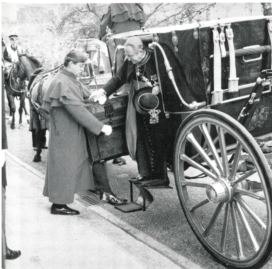
in London: im Staatslandauer nach der Überreichung des Beglaubigungsschreibens als erster päpstlicher Nuntius in Grossbritannien seit Heinrich VIII.

über 3000 Wappen gezeichnet, so auch diejenigen der letzten vier Päpste. Im Kölner Dom wurden Fenster nach seinen Entwürfen als Glasgemälde ausgeführt. 1978 erschien die englische Fassung seiner Wappenstudien mit Selbstillustration: «Heraldry in the Catholic Church: Its Origin, Customs and Laws». Erzbischof Heim ist Mitglied vieler heraldischer Gesellschaften, da er die Tradition dieser uralten Kunst genau kennt und weiterführt.