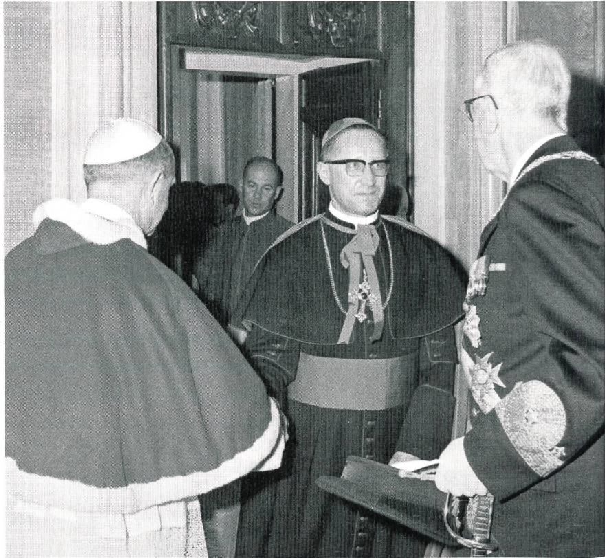
im Vatikan: mit Papst Paul VI. und Gustav VI. Adolf, König von Schweden Überreichung des Beglaubigungsschreibens an Nasser

Nach dieser schönen Zusammenarbeit in Paris kam Heim für 3 Jahre als Auditor an die Nuntiatur in Wien, dann für 7 Jahre nach Deutschland, wo sich eine besondere Beziehung zu Bundeskanzler Konrad Adenauer entwickelte, der ganz spontan Vertrauen zum «Schweizer» Botschaftsrat Heim fasste. Er lud ihn öfters zu Besprechungen und auch zum Bocciaspiel in seinen Garten ein und liebte es, ihn zuhause des Vatikans über seine Probleme und Absichten direkt zu informieren. Infolge einer Verwechslung kam es sogar für drei Wochen zu einem Hutaustausch, bis Bruno Heim an seinem Hut anstelle des B.H. das Dr.-K.-A.-Zeichen entdeckte und bei Adenauer anrief: «Ich habe den Hut des Bundeskanzlers, und er hat meinen!», was zum fröhlichen Wiederaustausch führte. 1961 wurde Bruno Heim zum Erzbischof von Xanthos und für 8 Jahre zum Apostolischen Delegaten in Skandinavien ernannt; er wurde erster päpstlicher Nuntius in Finnland. Von 1969 bis 1973 war er dann Nuntius und Präsident der Caritas in Ägypten; sein Beglaubigungsschreiben überreichte er Nasser, und 3 Jahre lang wirkte er unter Sadat; er erlebte viele Staatsbesuche, z.B. mit dem Negus von Abessinien, Tito, «Kaiser» Bocassa, Jassir Arafat, König Faisal von