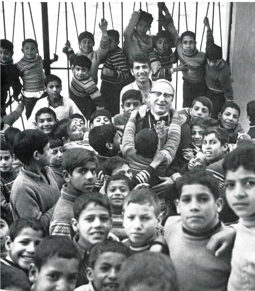
Besuch eines Waisenhauses in Kairo bei den Lumpensammlern von Kairo

Saudi-Arabien, König Hussein von Jordanien usw. In Ägypten ging es vor allem darum, die ökumenische Verbindung mit der koptischen Kirche zu vertiefen. Erzbischof Heim konnte den neuen Kathedralenbau von Kairo unterstützen, indem er die Schenkung des Carraramarmors durch die europäischen Bischöfe veranlasste. Als Präsident der Caritas besuchte er die Waisenhäuser Ägyptens und setzte sich auch für die vielen Armen ein. Er war in Ägypten so beliebt, dass es zu einem Protesttelegramm des koptischen Papstes Shenuda nach Rom kam, als er wegberufen wurde.