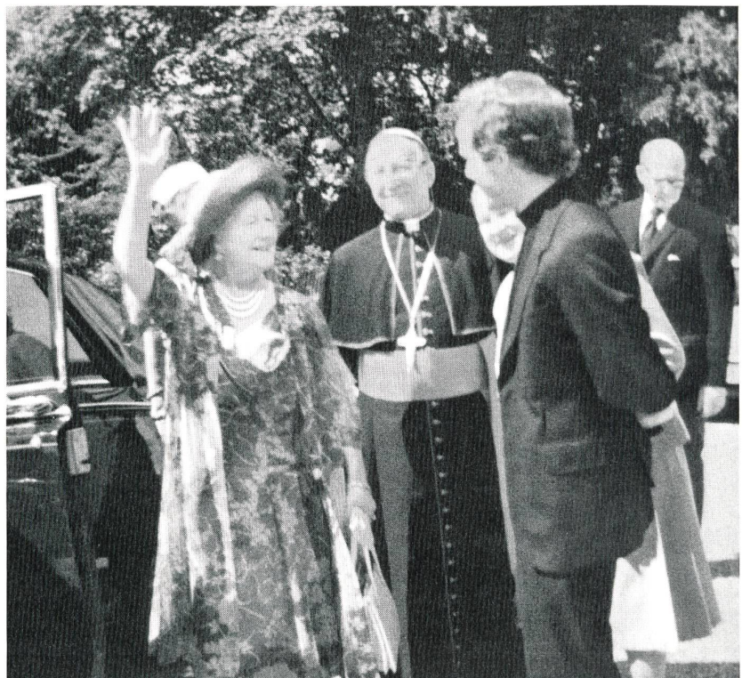
Besuch der Queen Mother