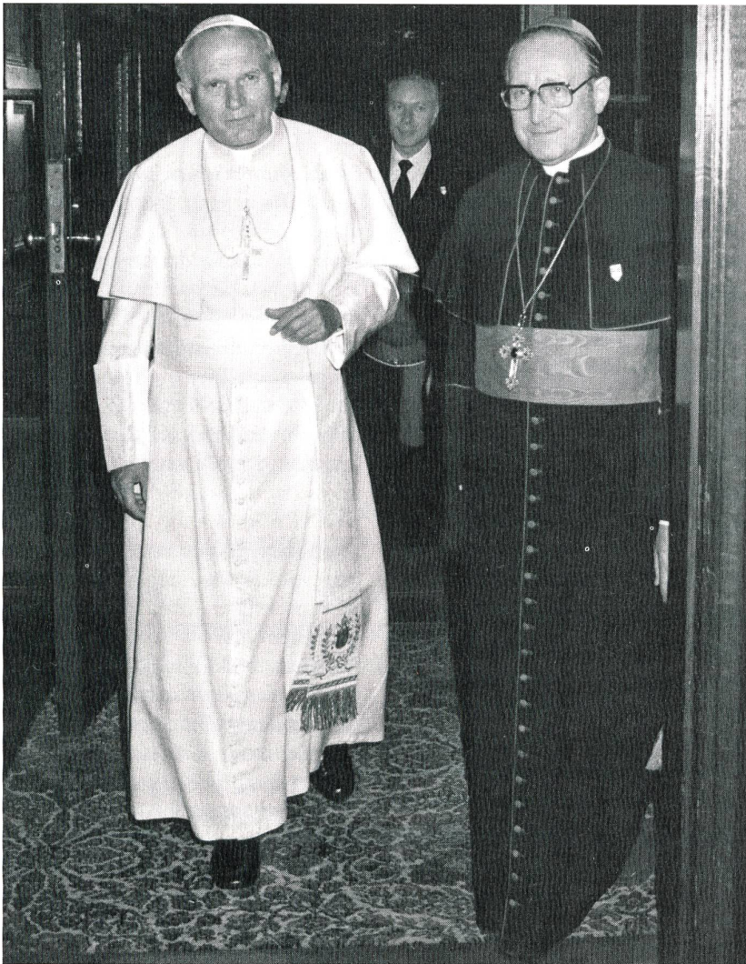
Papst Johannes Paul in London

Mutter wollte es gerne sehen, so dass es zu einer Einladung an sie kam, bei welcher Gelegenheit sich der Nuntius als perfekter Koch erwies. «Ich kann gut kochen, lernte es bei meiner Mutter. So kamen schliesslich alle zu mir auf Besuch, die Kents, die Gloucesters, der Archbishop of Canterbury, der Lord Mayor; und mit allen habe ich mich gut verstanden.» Es widerfuhr ihm sogar die hohe Ehre, dass er nach dem Tode von Lord Mountbatten, dem Onkel der englischen Königin, zu dessen Nachfolger als Patron der Cambridge University Heraldic and Genealogical Society gewählt wurde! Auch Agatha Christie war sein Gast. «Alles Englisch, das ich kann, verdanke ich der Lektüre Ihrer Krimis», hatte ihr der Nuntius geschrieben, was zu einer fröhlichen Einladung führte.