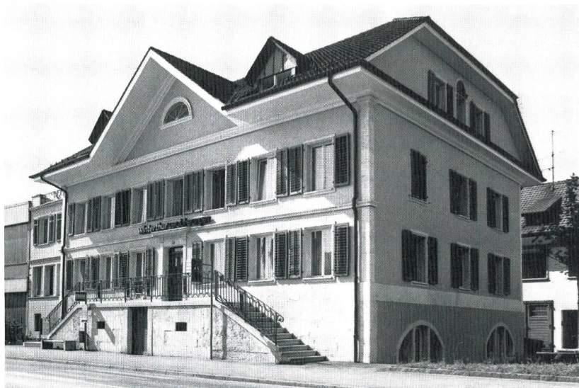
Heute steht das ehemalige Josefshaus an der Solothurnerstrasse 101 in Olten in neuem Glanz da.