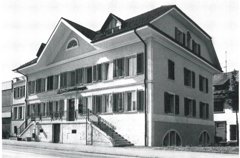
Heute steht das ehemalige Josefshaus an der Solothurnerstrasse 101 in Olten in neuem Glanz da.