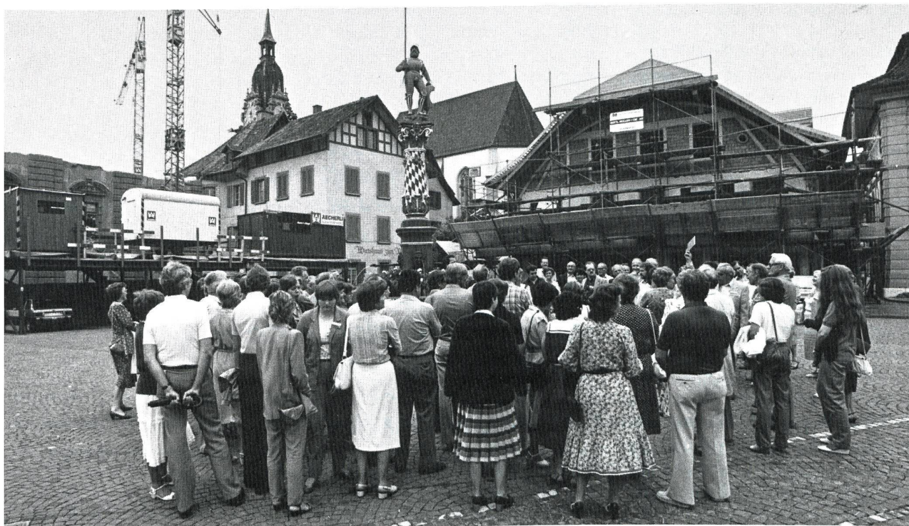
Besuch eines reizenden Städtchens: Zofingen.

es waren die Jugendlichen, die Schüler, mit einem Thema, das sich harmonisch in ihr Lehrprogramm einfügen würde. Nachdem kurz zuvor das Historische Museum in Olten für den «modernen pädagogisch wertvollen Aufbau» und das Naturmuseum in Solothurn für seine «lebendige Atmosphäre» eine europäische Auszeichnung erhalten hatten, lag das Thema «Museen» eigentlich auf der Hand. Das Programm sollten das Musikautomatenmuseum in Seewen und das Technorama in Winterthur ergänzen. Die grosse Anzahl der Anmeldungen war überraschend, und die Begeisterung der jugendlichen Eingeladenen wirkte ansteckend. Es liess erstaunen, wie gefragt das Technorama in Winterthur war. Vorausblickend war es wohl die weite Reise, im Rückblick aber gewiss die anschaulich dargestellten Beispiele aus der Welt der