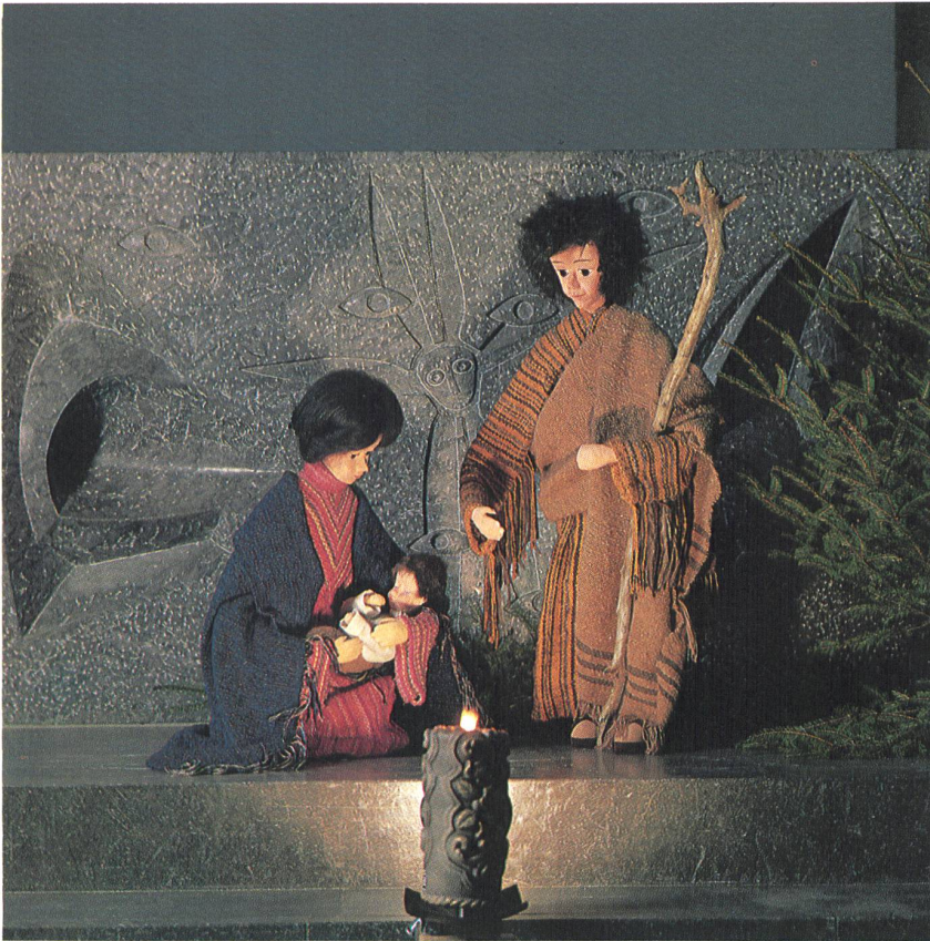
Maria Königin, Obergösgen