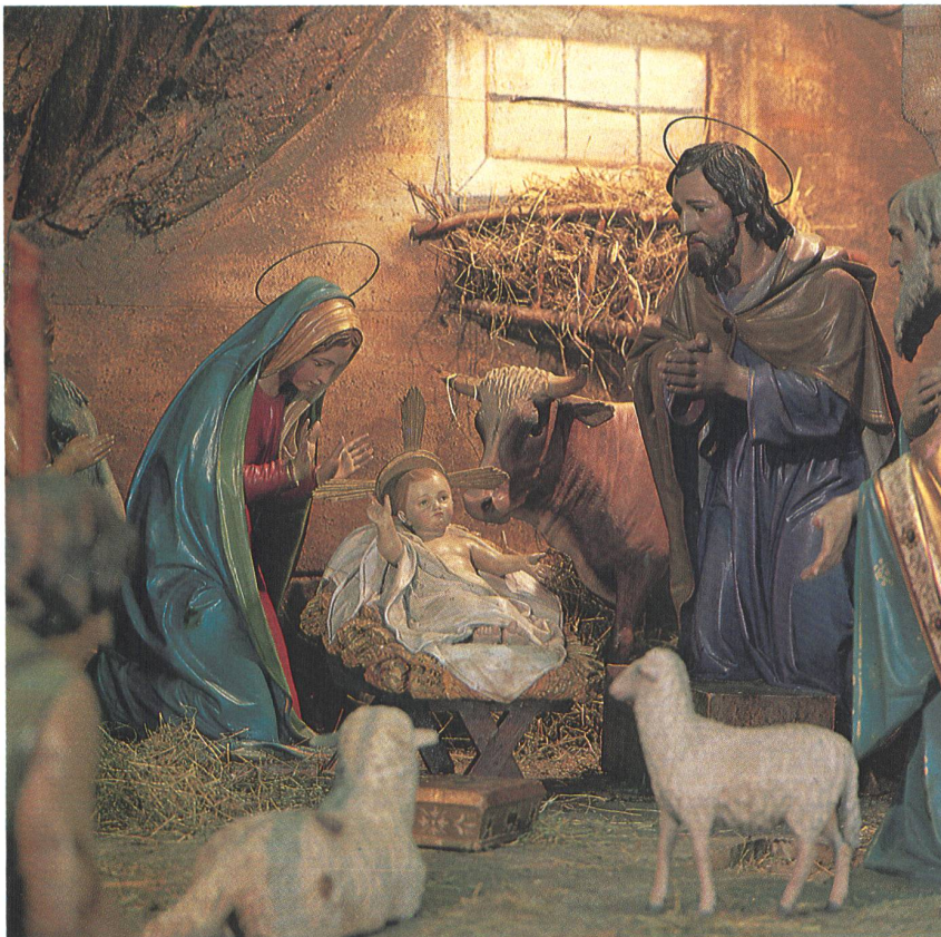
St. Martin, Olten

von denen wir nur einige wenige auswählen konnten. Thomas Ledergerber hat für Sie letztes Jahr diese Krippen fotografiert, und ich danke den verschiedenen Persönlichkeiten, die mir über die Geschichte und Herkunft der ausgewählten Krippen so bereitwillig Auskunft gegeben haben. Die Krippen, die wir vorstellen, sind in Kirchen aufgestellt, die ganztägig geöffnet sind, so dass jedermann auch ausserhalb der Gottesdienste diese Zeugnisse volksnaher religiöser Kunst betrachten und sich darüber freuen kann!