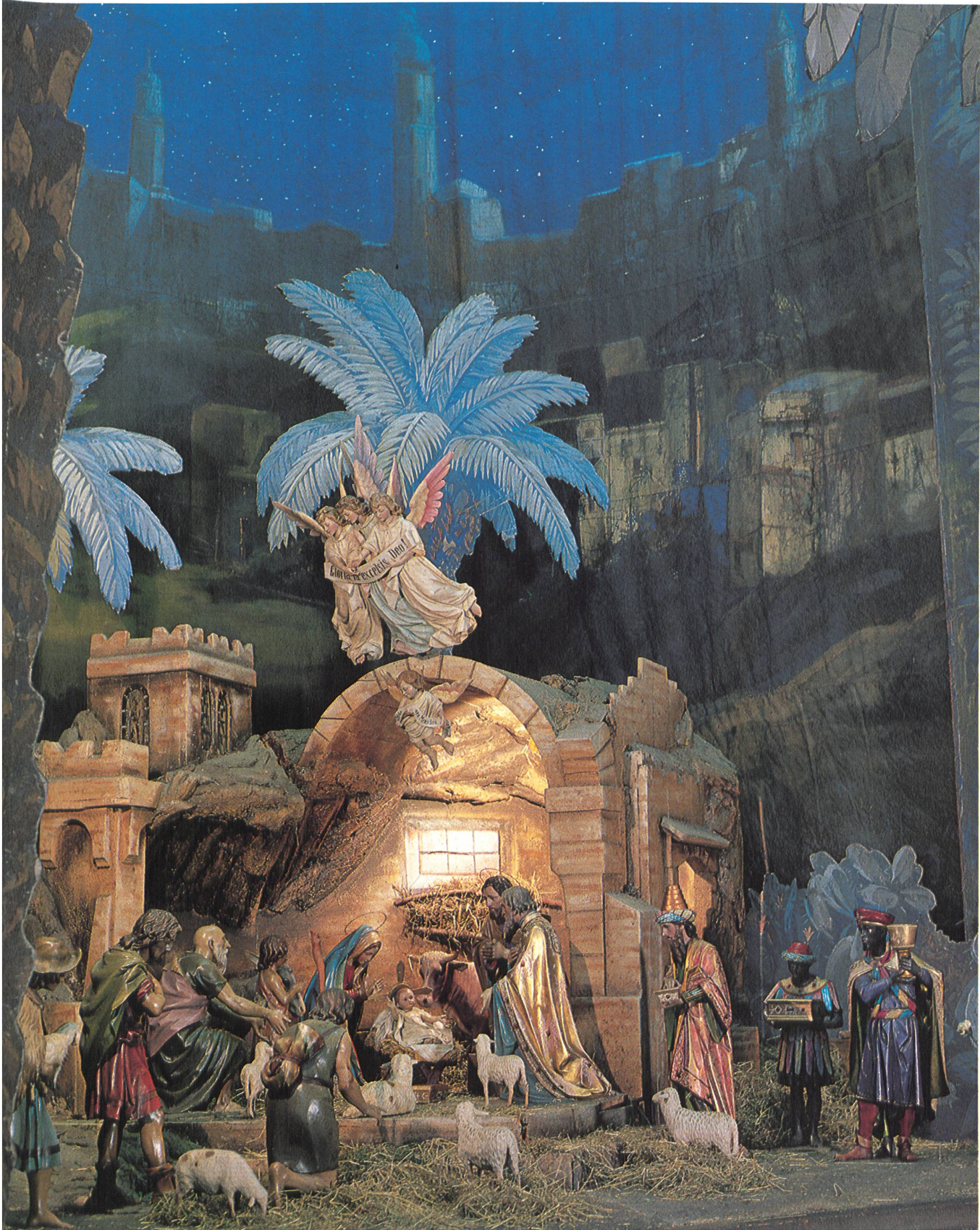
St. Martin, Olten