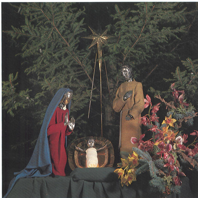
St. Marien, Olten

Die Darstellung ist einem volkstümlichen, unabstrakten Realismus verpflichtet und wirkt besonders durch ihre Monumentalität und Farbenpracht. Sie nimmt einen ganzen Seitenaltar ein und macht wegen der Kulissen und deren Tiefenwirkung einen recht theatralischen Eindruck im Sinne einer eigentlichen Guckkastendarstellung. Symbolisch ist die Verwendung der Farben, z. B. bei den Zentralfiguren Maria (Rot = Liebe, Blau = Treue), Josef (Gelb = Weis-