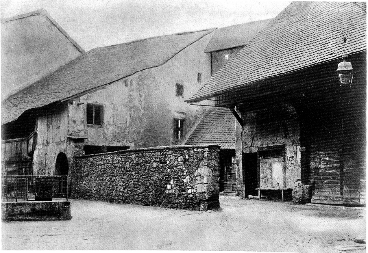
Blick in den kurz vor der Jahrhundertwende abgerissenen Scheunenkomplex hinter dem Gasthaus «Zum Kreuz».

uns diese Türme damals in der Art der Museggtürme vorzustellen, als dreiseitig aufgemauerte Turmbauten mit offener Rückseite. 37 Seinen schlanken Helm, wie wir ihn von der Darstellung in Herrlibergers Topographie kennen 38 , erhielt das Obertor ja erst 1575/84 39 . Die bedeutendsten Veränderungen aber dürfte das Bild des mittelalterlichen Olten im Bereich des Zielempe erfahren haben. Was wir heute, dank dem in seinen Ansätzen noch erhaltenen Eckturm als Zielempe-Schloss betrachten, ist nämlich nicht mehr als ein durch an der Wende zum 20. Jahrhundert entstandene, unschöne Vorbauten zusätzlich beeinträchtigter Rest dieses ehemals beeindruckenden Eckbaues. Der 1868 geschaffene Durchbruch gegen den Klosterplatz verfälschte durch die gänzliche Umgestaltung des