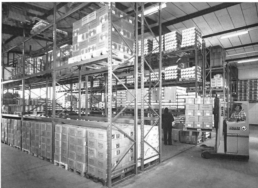
Teilansicht Lagerhaus Somona Dulliken

nahme der General-Vertretungen führender Herstellerfirmen im Inland und im Ausland. Damit hat Somona eine ganze Anzahl von Produkten als Neuheiten ins biona-Reformhaus gebracht und einen wirksamen Beitrag zur Leistungssteigerung der Branche geleistet.