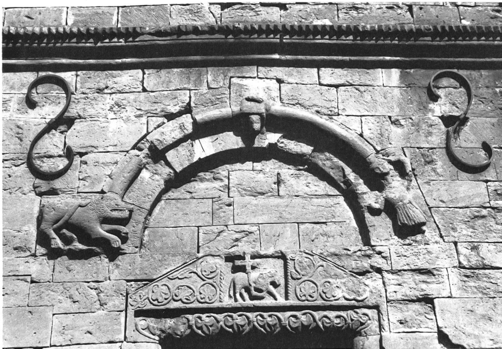
Figureschmuck über dem Portal: Lamm Gottes mit Kreuz, Rittergestalt und Löwe

umschrieben. Zahlreiche Hofstätten mit zugehörigem Ackerland werden aufgeführt, Nutz-