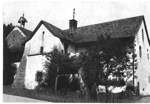
Meyerhaus mit dem Rest des durch Strebepfeiler gestützten Turmes

einem Enkel des Stifters. Er räumte mit allem auf, was nicht der Regel des heiligen Benedikt entsprach, hielt die Mönche zu strenger Zucht an und forderte Disziplin in der monastischen Tagesordnung. Ferner wandte er sich an das Kapitel in Basel und erreichte, dass der Bischof die alten Schenkungen, insbesondere auch die Verfügung Ortliebs über die Zehntenfreiheit bestätigte. Graf Hermann selbst bedachte das Kloster mit Vergabungen und Stiftungen, worauf auch etliche der froburgischen Ministerialen seinem Beispiel folgten.