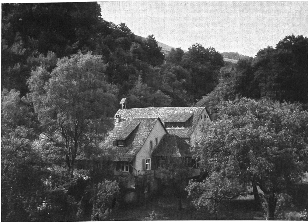
Schöntal von Südosten. Das ehemalige Kloster liegt in einem Seitentälchen am Obern Hauenstein in einer Mulde eingebettet

hörte einstmals zur Klosterkirche und stellt «das älteste erhaltene rein romanische Bauwerk der Schweiz dar», wie der illustrierte Führer des Kantons Baselland vermerkt. Die markante, nunmehr leider stark verwitterte Eingangsseite besteht aus grossen Quadern und wird durch ein Gurtgesimse zweigeteilt, wobei in der untern Partie das Portal die Aufmerksamkeit des Betrachters unwillkürlich auf sich lenkt (Bild 3). Aus den feingliedrigen Blattornamenten am Sturzstein tritt deutlich das Agnus Dei, das Lamm Gottes, hervor, auf dessen rechtes Vorderbein sich das Kreuz stützt. Ein wulstartiger Halbrundbogen, getragen von einer Rittergestalt und einem Löwen – Symbole des Guten und Bösen – bildet einen weitem Abschluss des Portals. Die auf dem