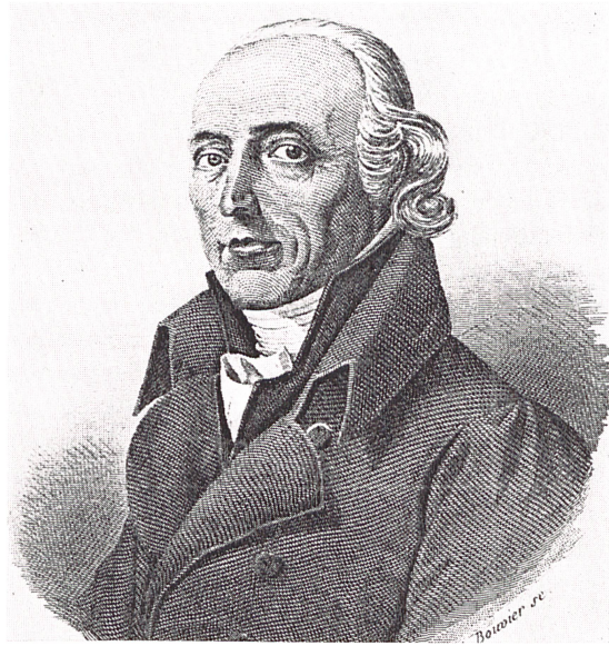
Johann Conrad Escher von der Linth