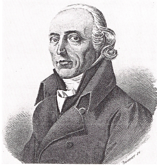
Johann Conrad Escher von der Linth