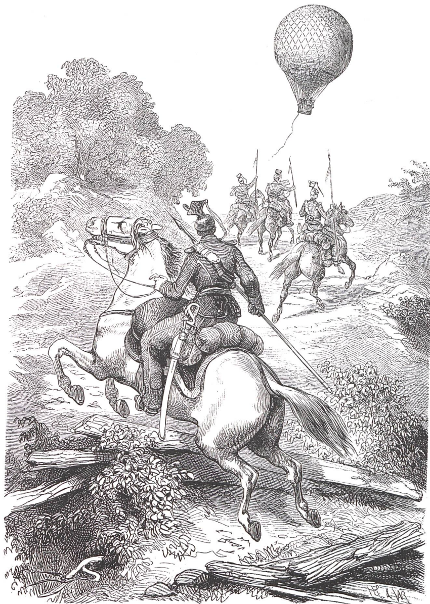
Verfolgung eines Ballons

des Heranrückens des Feindes beeilt hatte, seine Frau und die beiden Töchter zu Verwandten nach Nevers in die Provinz zu schicken. Inzwischen dürfte auch Nevers, das sich halbwegs zwischen Paris und Lyon befindet, als gefährdet betrachtet worden sein; denn gerade um diese Zeit verlegte auch die Regierung ihren Sitz von Tours nach