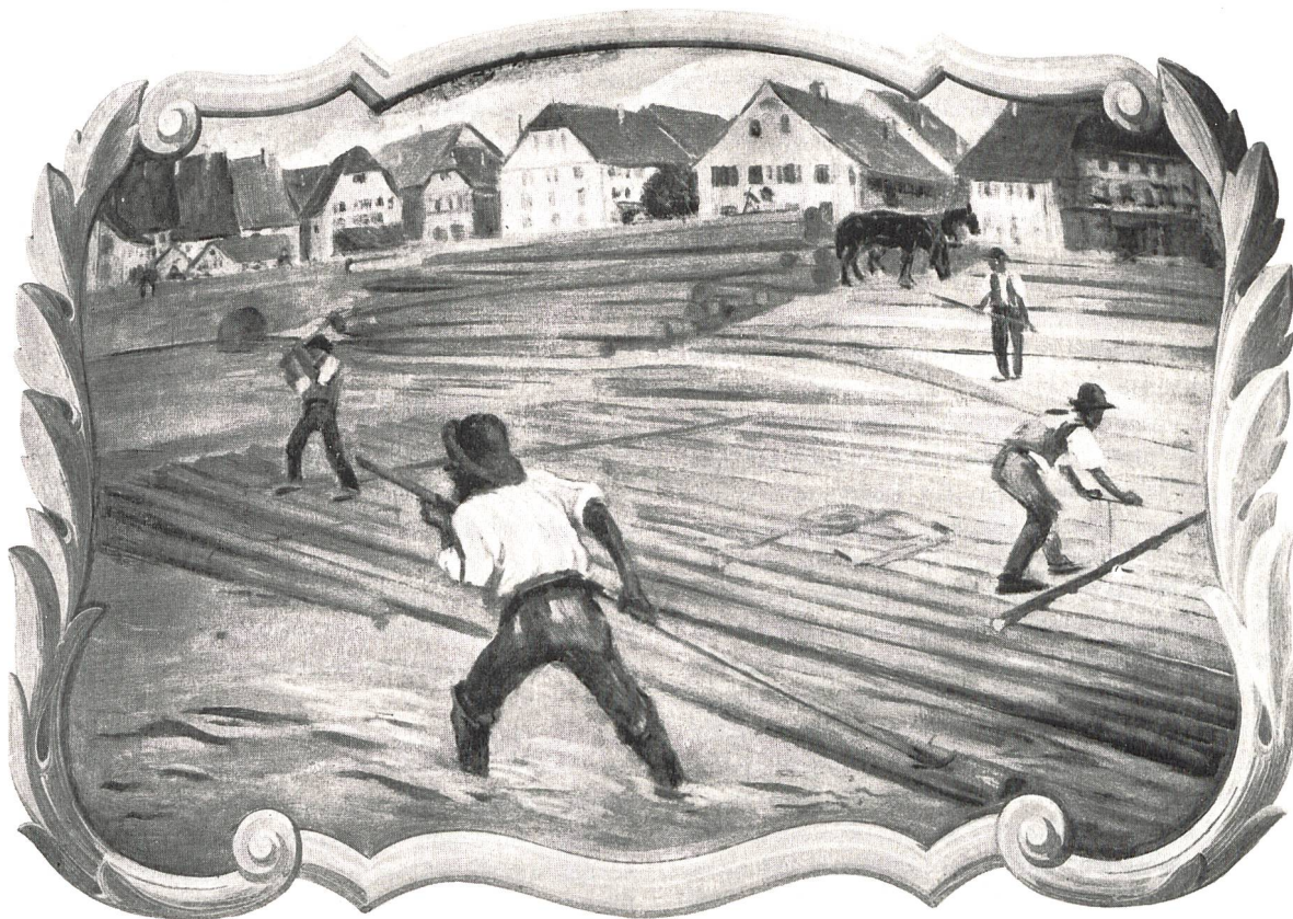
Abbildung 3: Mit langen Ländtehaken werden die Tannen ins Wasser gewälzt. Wandbild von Charles Welti im «Bären» Aarburg.

mit ihren zahlreichen anliegenden Städten und dem dicht bewaldeten Einzugsgebiet nahm in der ersten Hälfte des 19. Jahrhunderts durch die Expansion der Eisenwerke Von Roll in Gerlafingen noch zu. Für die Hochöfen und Hämmer mussten immense Holzmengen bereitgestellt werden. Der Hochofen in der Klus beispielsweise benötigte im Jahre 1820 bei einer Produktion von 700 Tonnen Roheisen 14000 Zentner Holzkohle. Die Firma