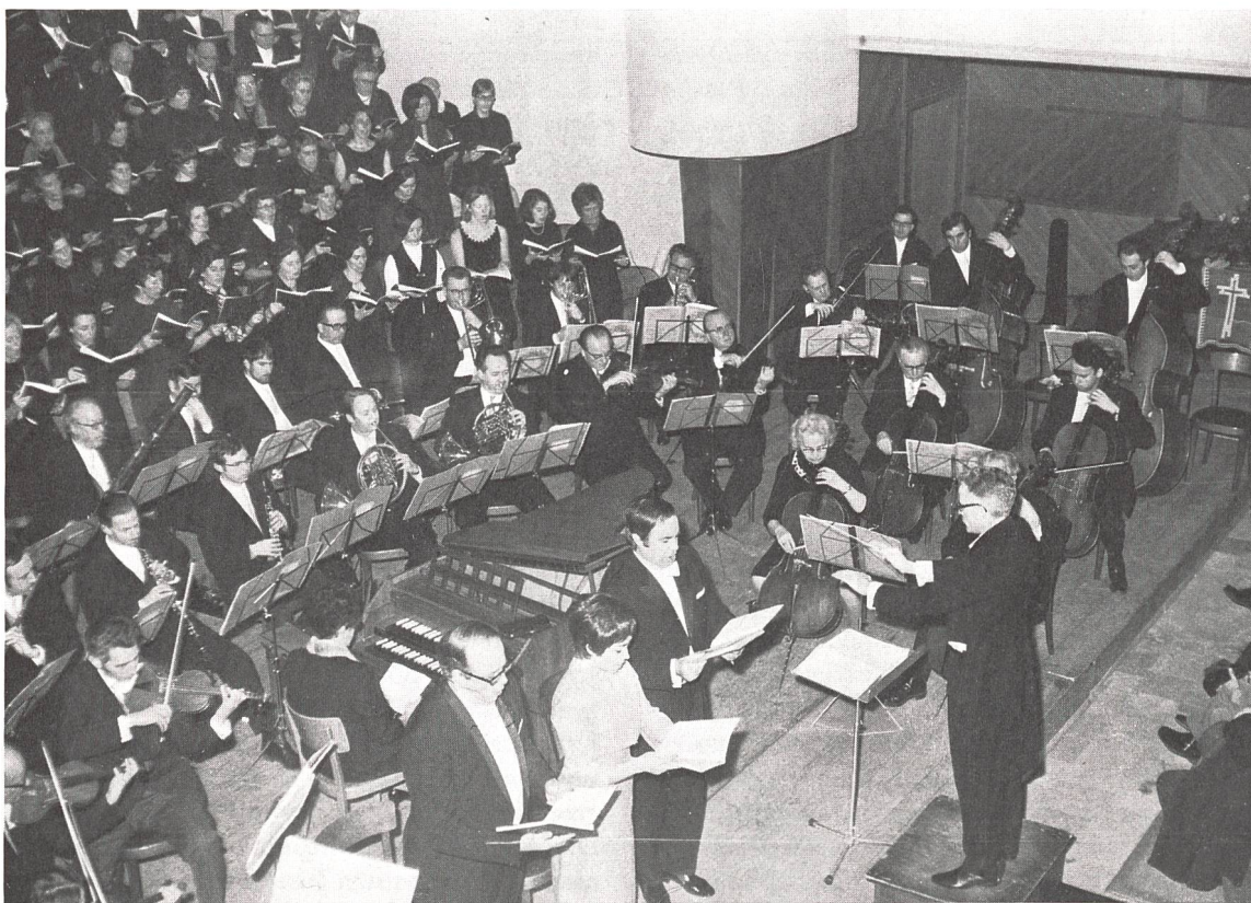
Oltner, 6. März 1971: Haydns «Jahreszeiten»

die Sänger, die sich in unserer Zeit des kurzfristigen Engagements nur für die eine oder andere Aufführung verpflichten können, sind willkommen; zumal sie meistens nach einiger Zeit den Weg zurückfinden. Vieles mag sich in der Zukunft ändern. Die Grundgegebenheiten chorischen Zusammenlebens: das Miteinander in musikalischer Aktivität, das Disziplinieren und doch wiederum Entspannen bei künstlerischer Arbeit, das Suchen und Streben nach gültigeren Werten, die Ergebenheit dem echten Kunstwerk gegenüber, sie werden bestimmende Kräfte des LGVO bleiben, der sich weiterhin zusammen mit dem um nur wenig älteren Solothurner Chor dafür einsetzen wird, das kulturelle Leben der beiden Städte mitzugestalten.