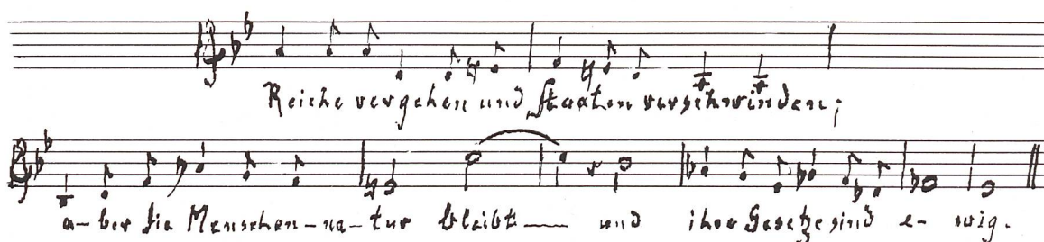
Thema der Schluss-Fuge aus der Pestalozzi-Kantate «Weisheit des Herzens».