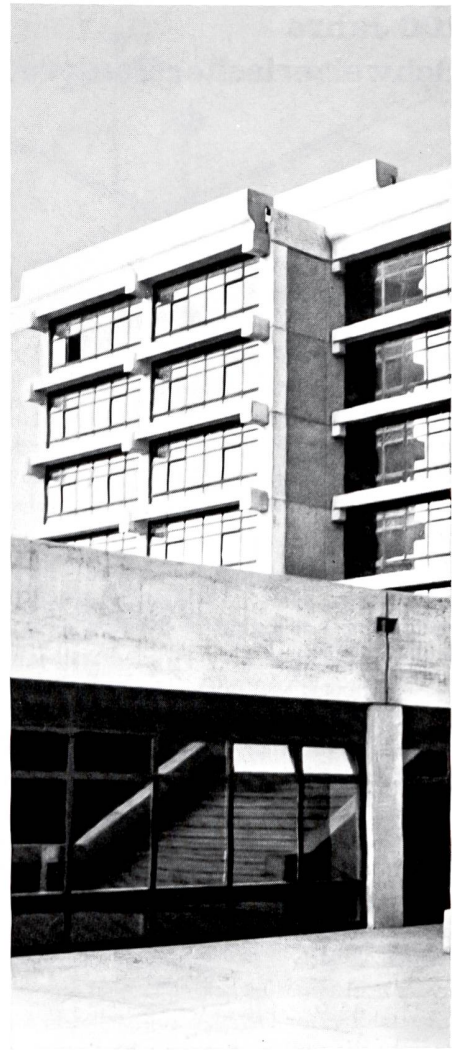
Der im Frühling bezugsbereite Trakt Die Strasse ist noch nicht ganz fertig...