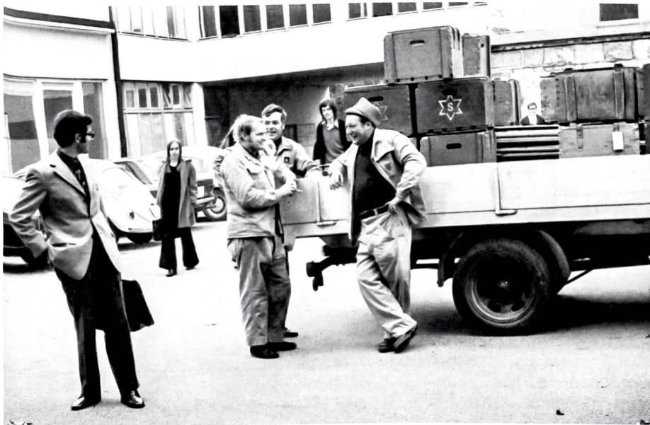
Abschied vom Frohheim: der Lastwagen ist beladen... Mit den Jahren ist viel zusammengekommen!