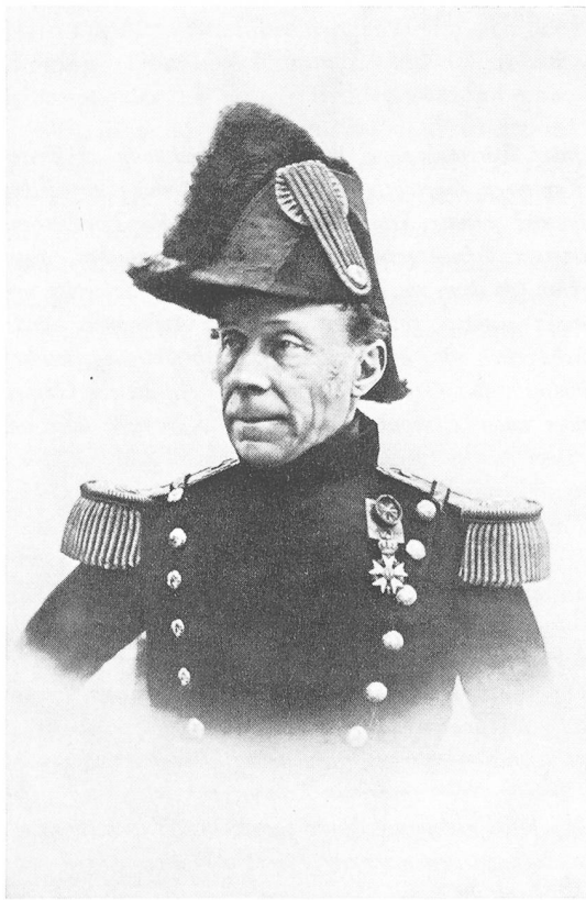
Wilhelm Heinrich Dufour