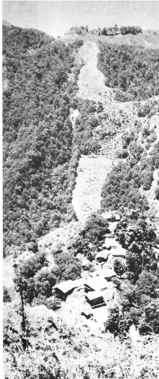
Die jaunsarischen Dörfer sind sehr isoliert gelegen

Ärzteteams zur Bekämpfung von Lepra und Geschlechtskrankheiten zur Verfügung. Ausserdem nahm die Distriktsbehörde den Kampf mit dem Analphabetentum auf.