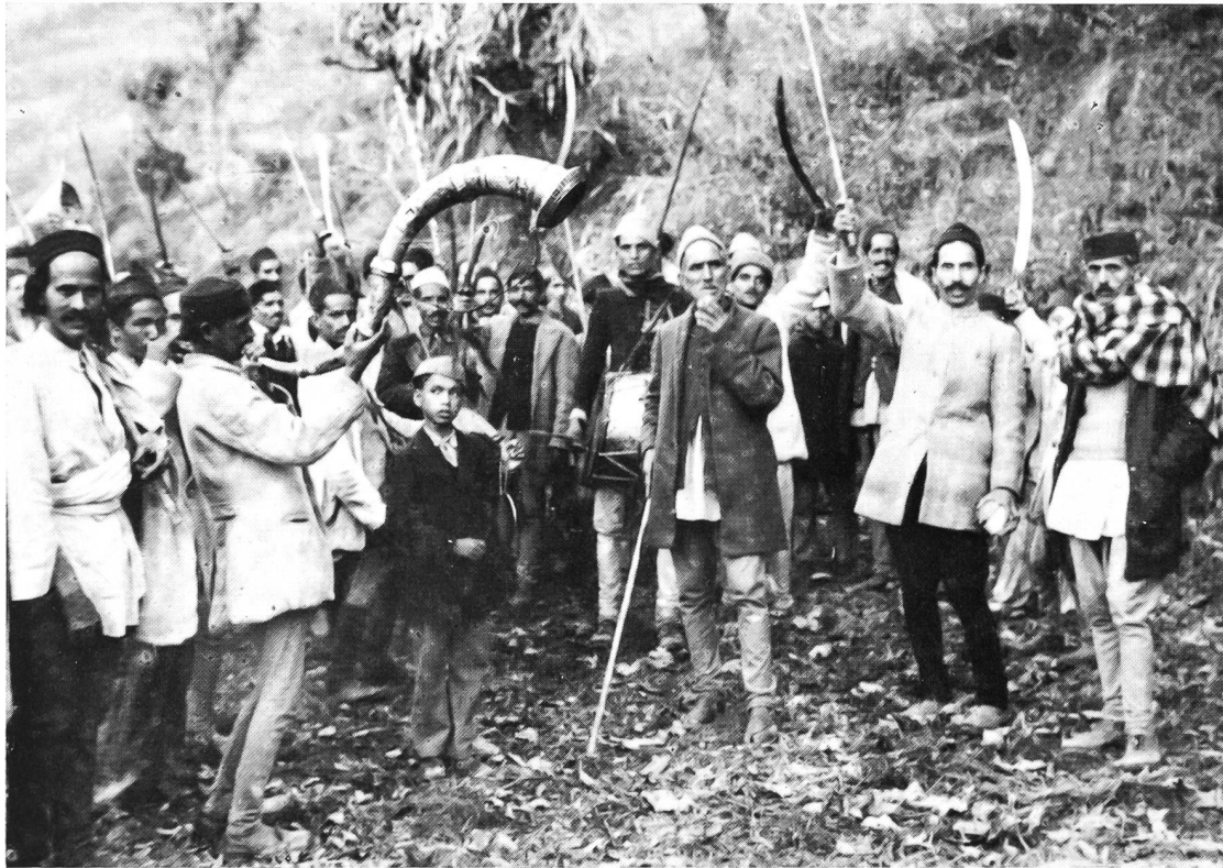
Vor dem Dorf des Bräutigams liefern die Begleiter der Braut den Dorfbewohnern einen Scheinkampf

sammlungen davon zu überzeugen, dass es gescheiter wäre, das Geld zum Ankauf von wertvollem Saatgut und Dünger zu verwenden. Aber da schritten die Frauen ein. Sie drohten, ihren Männern davonzulaufen. Die Frauen haben in Jaunsar-Bawar beachtlich viel zu sagen. Folglich blieb alles beim alten!