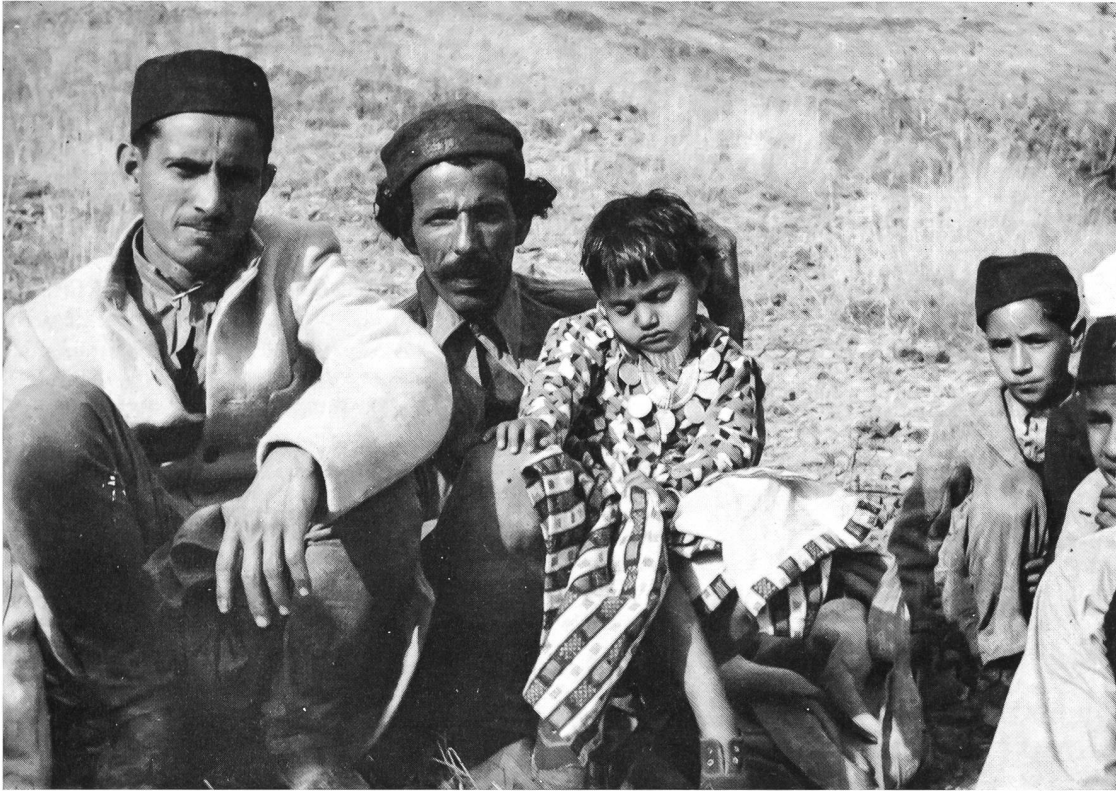
Dieses kleine Mädchen wird von Verwandten und Dorfgenossern zur Hochzeit geleitet

Mann und flüsterte ihm etwas zu. Sogleich brach der Mann sein Gespräch ab und trieb mit der Frau die Schafe weiter. Die Studenten blieben perplex zurück. Sie hatten bisher die Erfahrung gemacht, dass Schäferinnen ganz gern auf ein Scherzwort eingingen. Weshalb jetzt die ablehnende Reaktion? Sehr einfach: Die Schäferin war diesmal nicht vom Vater oder Bruder, sondern vom Gatten begleitet gewesen, und während die Jaunsari durchaus nichts dagegen haben, wenn man sich einer Frau in Gegenwart des Vaters oder des Bruders nähert, empfinden sie dasselbe Verhalten als höchst ungebührlich, wenn der Gatte in der Nähe ist. In diesem Fall hatte also ein Mangel an Kenntnissen der jaunsarischen Sitten zu einem Misserfolg geführt.