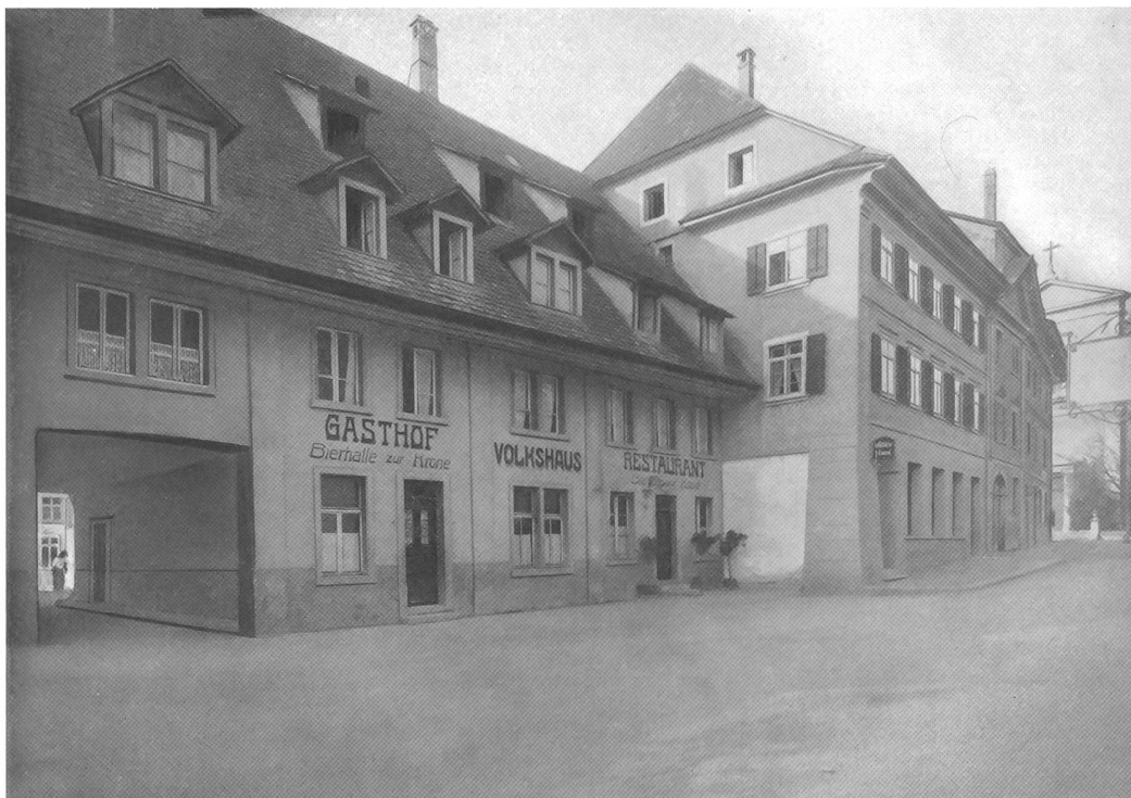
Das «Volkshaus», ehemals unterhalb der «Krone».