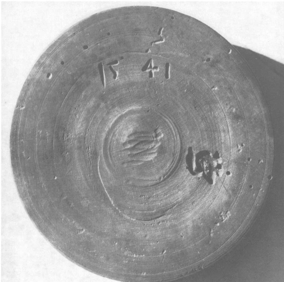
Rückseite eines Holzmodells, Durchmesser 12 cm, 16. Jahrhundert

sehr mühsam, da die Förmchen während der ganzen Verarbeitung in den Händen gehalten werden müssen und nicht anderswie festgemacht werden können. Zudem müssen natürlich Schriften und Zahlen «spiegelverkehrt» geschnitzt werden, was oft einiges an Vorstellungsvermögen voraussetzt.