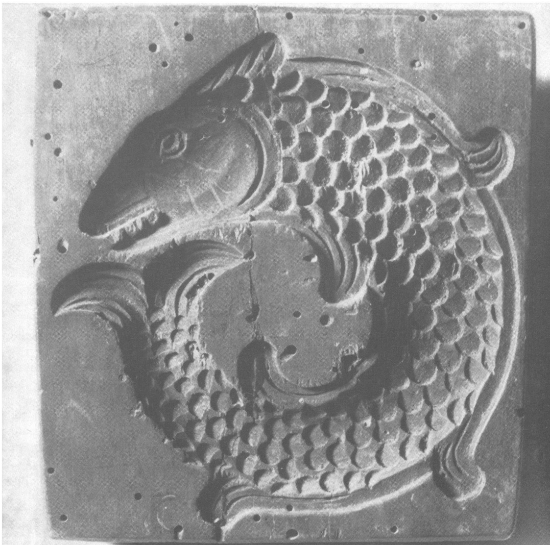
Model aus Apfelbaumholz «für Anisguetzli», 10×10 cm, 18. Jahrhundert

Woher kamen die Holzmödeli? Diese besorgte der gewandte Holzschnitzer. Holzmödeli werden aus hartem, kurzfasrigem Holz hergestellt, in welches man die feinsten Formen schneiden kann. Zudem sind Hartholzformen beinahe unverwüstlich, obwohl auch sie durch ständiges Brauchen und Abwaschen abgenützt werden und verflachen. Das Schnitzen selber ist