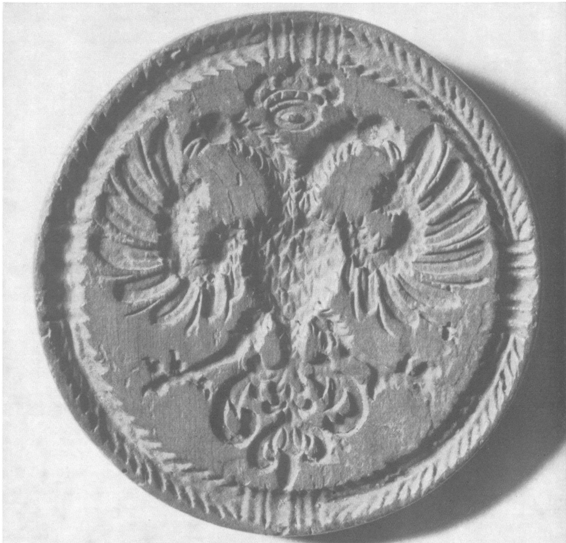
Ahornholzmodel, Durchmesser 18 cm, 18. Jahrhundert

Holzformenschnitzer haben in der Regel ihre Arbeiten nicht signiert, denn sie wollten nicht in