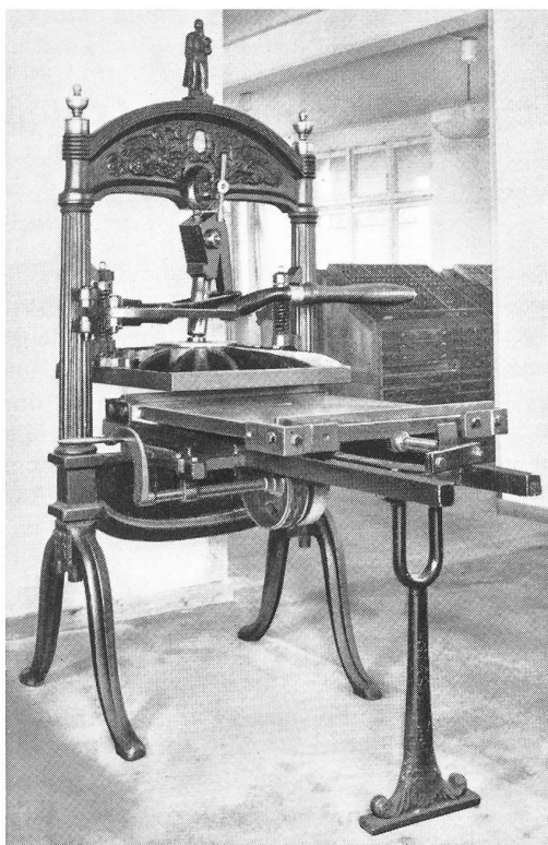
Abb. 1 Alte Handpresse