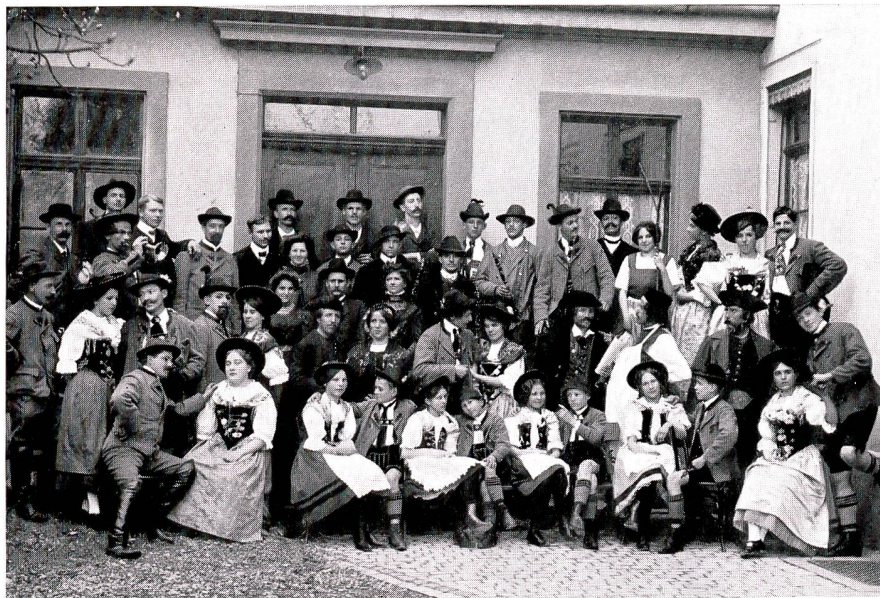
Sängerbund Otten «Almenrausch und Edelweiß»

Jetzt waren die Voraussetzungen für ein reges theatralisches Leben vorhanden. Dieses setzte denn auch wirklich ein. In den Jahren 1817 bis 1820 wurden nicht weniger als 7 Stücke von Kotzebue aufgeführt: «Menschenhass und Reue» (1817), «Das Gastrecht» (1817), «Der Eremit von Formentera» (1818), «Blind geladen» (1818), «Johann von Montfaucon» (1819), «Die Versöhnung oder die feindlichen Brüder» (1820) und «Die Tochter Pharaonis» (1820). Den Aufführungen dieser seichten Modeprodukte Kotzebues folgte im Jahre 1823 das Rührstück «Das Bild» von Ernst von Houwald.