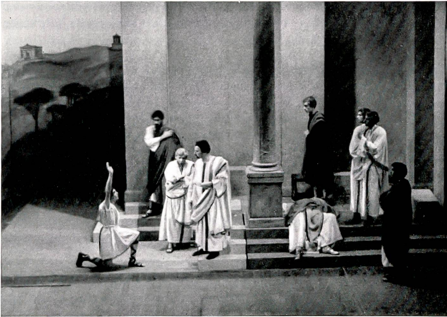
Dramatische Gesellschaft Olten «Julius Cäsar» 1942