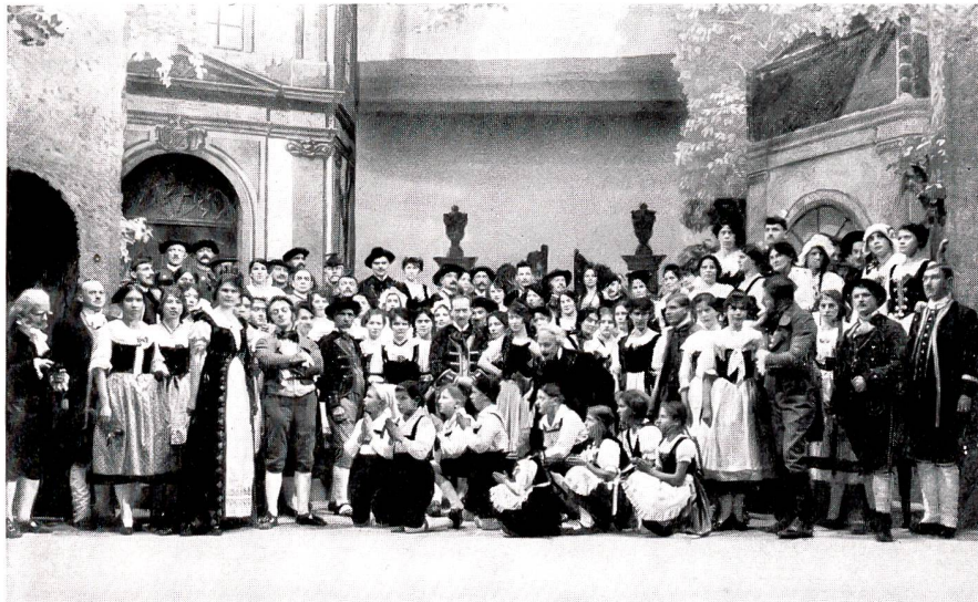
Gesangverein Olten «Der Wildschütz» 1919