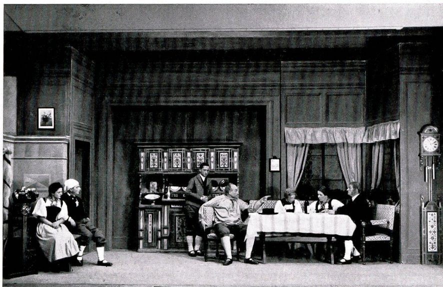
Heimatschutz- Spielvereinigung Olten «Geld und Geist» 1943