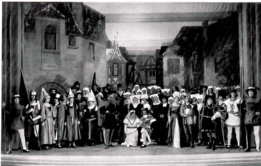
Gesangverein Olten «Der Waffenschmied» 1926