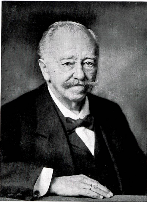
Louis Giroud (1840–1919) Ehrenbürger der Stadt Olten, der verdiente Förderer und geistige Vater des heutigen Stadttheaters

und später in der «Tanzlaube» (heute «Kornhaus» Meyer-Ennemoser). Das «Wochenblatt für Olten und Gösgen» (1853) weiss über den letztgenannten Schauplatz folgende amüsante Einzelheiten zu berichten: