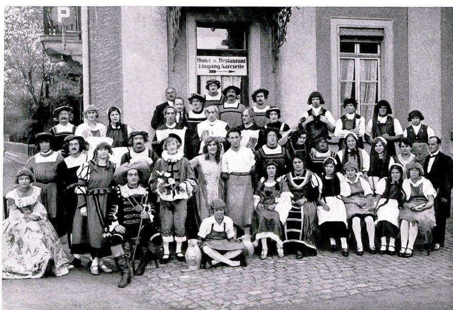
Männerchor Eintracht «Die goldne Meisterin» 1929

der Aufführung ist nichts Bestimmtes überliefert. Der Entschluss, die Theatergesellschaft, deren Tätigkeit, wie wir sahen, bis in die Neunzigerjahre des 18. Jahrhunderts zurückreicht, in eine feste Organisation zu bringen, deutet auf eine innere Festigung hin, die nicht zuletzt der Aufführung dieses klassischen Werkes zuzuschreiben ist. Die Konstituierung erfolgte am 22. Oktober 1824.