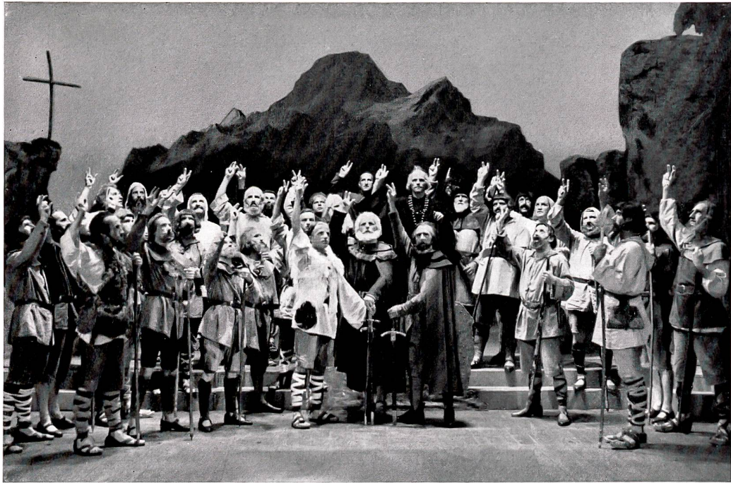
Dramatische Gesellschaft Olten / «Wilhelm Tell» 1941

eine Probe geleitet, wurde aber während derselben von einem plötzlichen schweren Unwohlsein überfallen, von dem er sich nicht mehr erholte. Er verschied nach zwanzigstündigem Leiden am nächsten Abend um 7 Uhr im 65. Altersjahre. So war er bis zu seinen letzten Stunden im Dienste des musikalisch-theatralischen Lebens unserer Stadt tätig, das er während Jahrzehnten mit nimmermüder Begeisterung und grossem Können förderte. Die Worte seines Grabredners, des Chorherrn und Dompredigers Peter Dietschi zu Solothurn, waren aus dem Herzen einer ganzen Generation gesprochen und lassen uns auch heute noch erkennen, von welcher Bedeutung das Wirken dieses edeln Mannes für das kulturelle Leben unserer Heimat war. Sie lauteten: