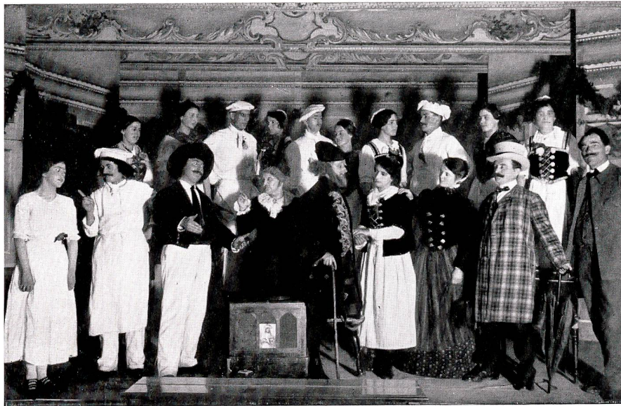
Sängerbund Otten «Der Leiermann und sein Pflege- kind» 1916