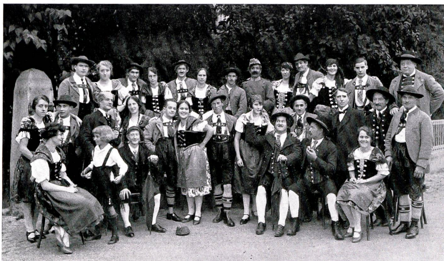
Männerchor Eintracht «Der fidele Bauer» 1927