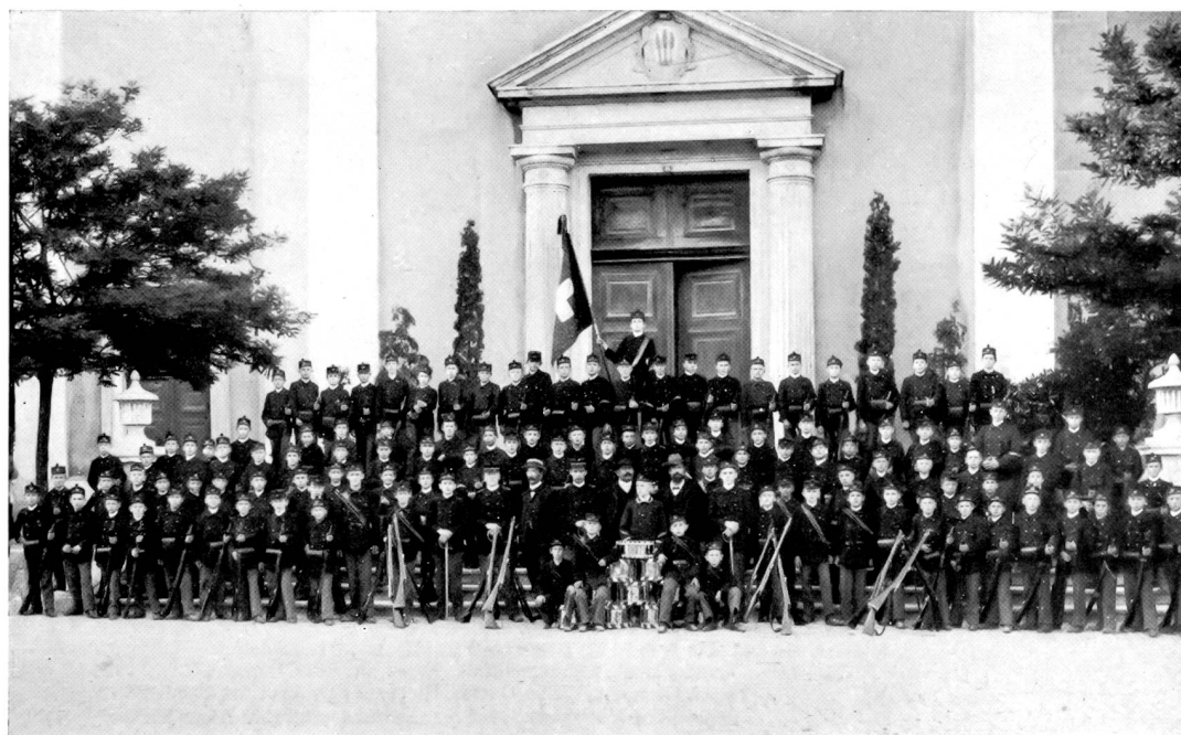
Kadetten-Korps der Stadt Olten 1909