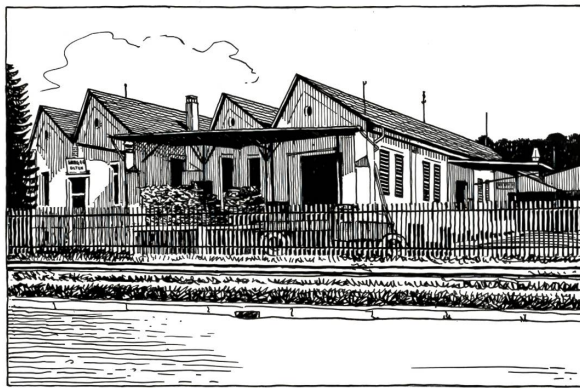
Erstes Lagerhaus 1916 im Oltner Industriequartier

Im Mittelalter noch war der Einzelhandel enger als heute mit dem handwerksmässigen Gewerbe verflochten. Erst in der zweiten Hälfte des vorigen Jahrhunderts begann sich eine Wandlung zu vollziehen, die sich mit dem Beginn des zwanzigsten Jahrhunderts beschleunigte. Das war zu jener Zeit, als die Verbraucher immer mehr sich zusammentaten, um die Arbeit der Warenverteilung selber und, wie sie glaubten, besser und billiger zu besorgen. Diese Bewegung entwickelte sich so ungestüm, dass das Schicksal der Glieder des selbständigen Kleinhandels in absehbarer Zeit als besiegt erschien. An diesen Untergang glaubte man auch in akademischen