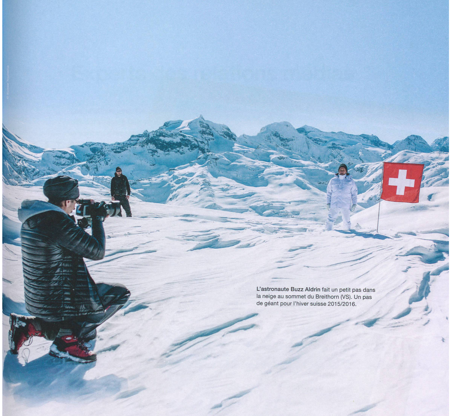
L'astronaute Buzz Aldrin fait un petit pas dans la neige au sommet du Breithorn (VS). Un pas de géant pour l'hiver suisse 2015/2016.