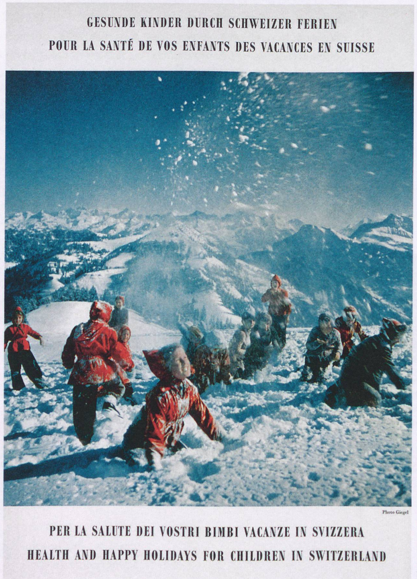
En 1952, le photographe attitré Philipp Giegel met en scène des enfants pour la campagne «Pour la santé de vos enfants, des vacances en Suisse».