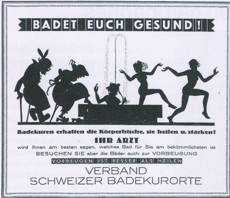
«Sources thermales et baignade en Suisse» (1926), thème de la première grande campagne de l'ONST.