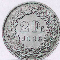
Le Conseil fédéral dévalue le franc pour faire face à la crise économique.