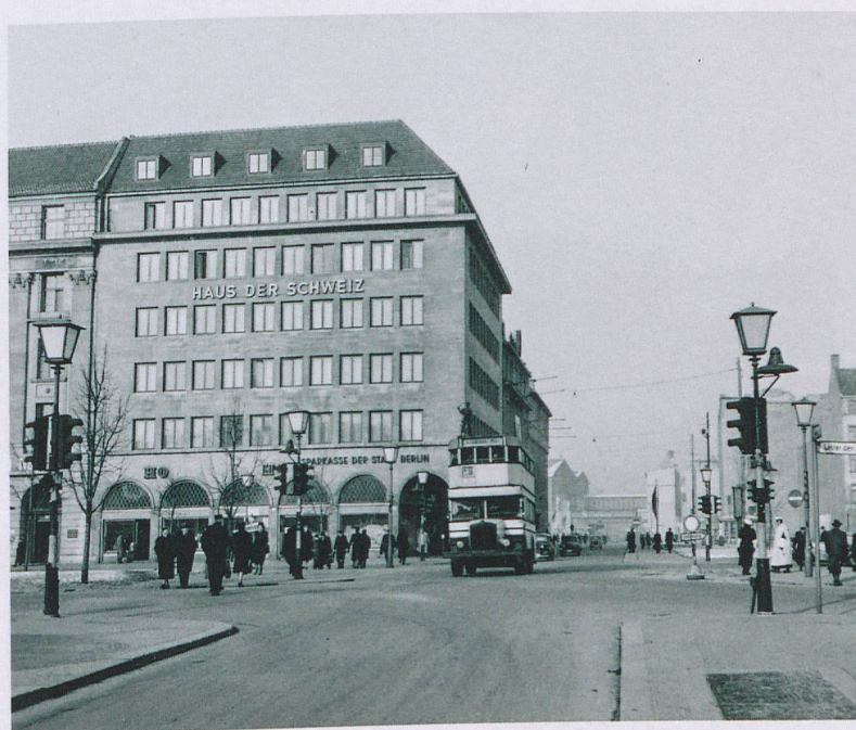
La Maison de la Suisse à Berlin: un bastion suisse durant les années de guerre.