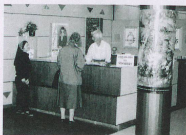
L'ONST ouvre un bureau à Stockholm pour assurer la promotion de la Suisse en Scandinavie. Suisse Tourisme est désormais revenu en Suède, après une interruption de quelques années.